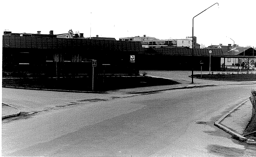
Hälsocenter fr.V, 5:20.