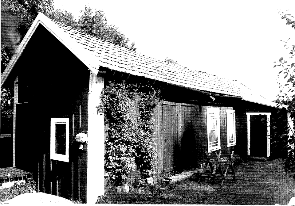
Neg. nr. V.T 06:26 Uthus mot sydväst