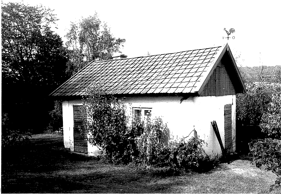
Neg. nr. V.T 06:25 Uthus mot sydost