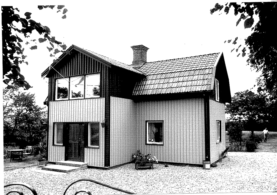
Neg. nr. V.T 07:3 Bostadshuset mot sydväst