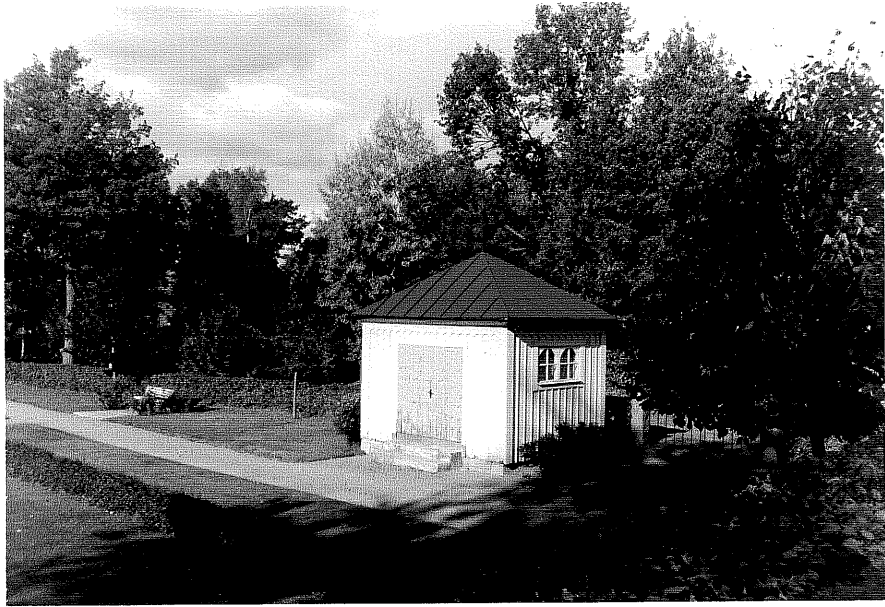
Neg nr ÖKM 12:31 Gravkapell från S0

Ödeshögs kommun Trehörna socken Trehörna kyrkogård 1:1