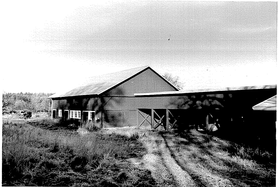
Neg. nr. T 04:05