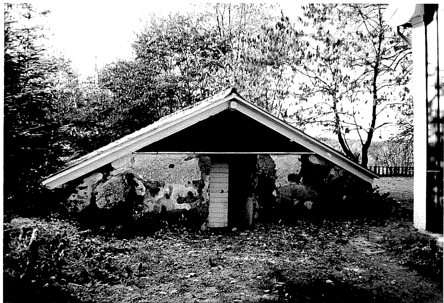
Neg. nr. T 04:03 Jordkällare från N