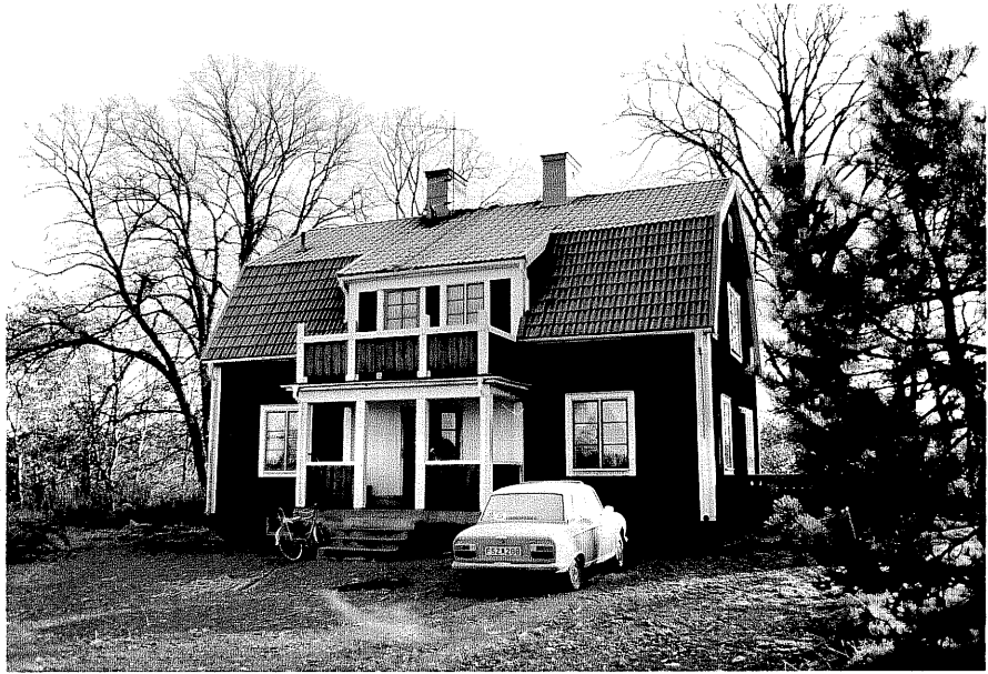
Neg. nr. T 04:02 Arbetarebostad från V