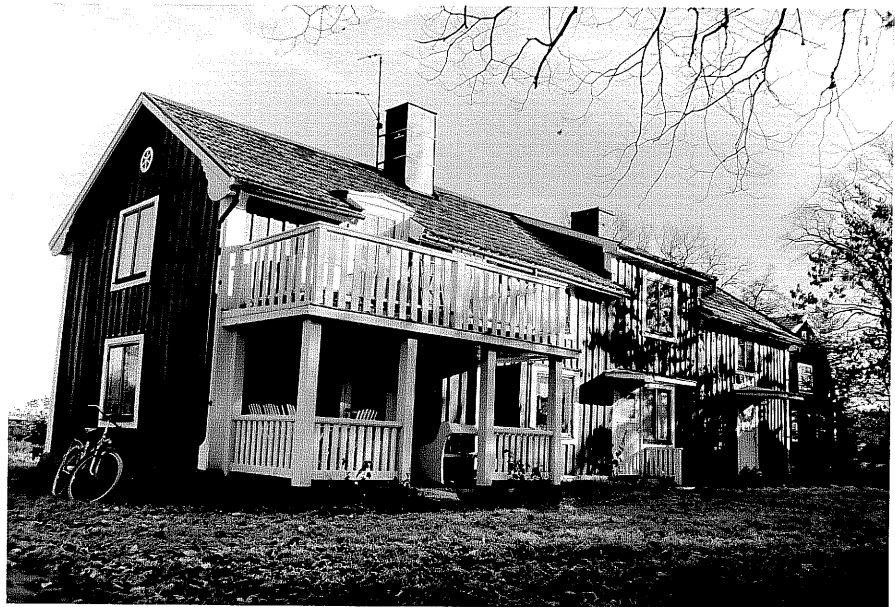
Neg. nr. T 04:07 Huvudbyggnaden från SV