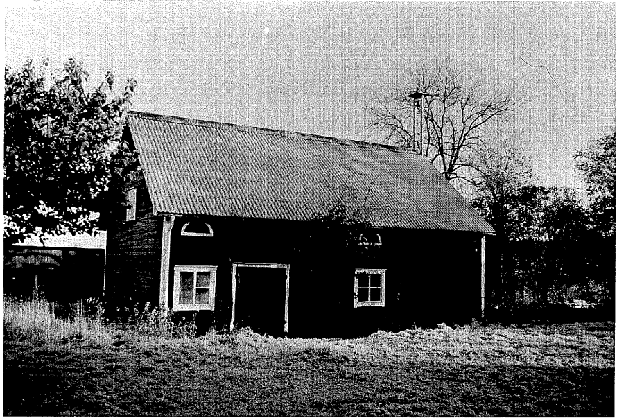
Neg. nr. T 04:04