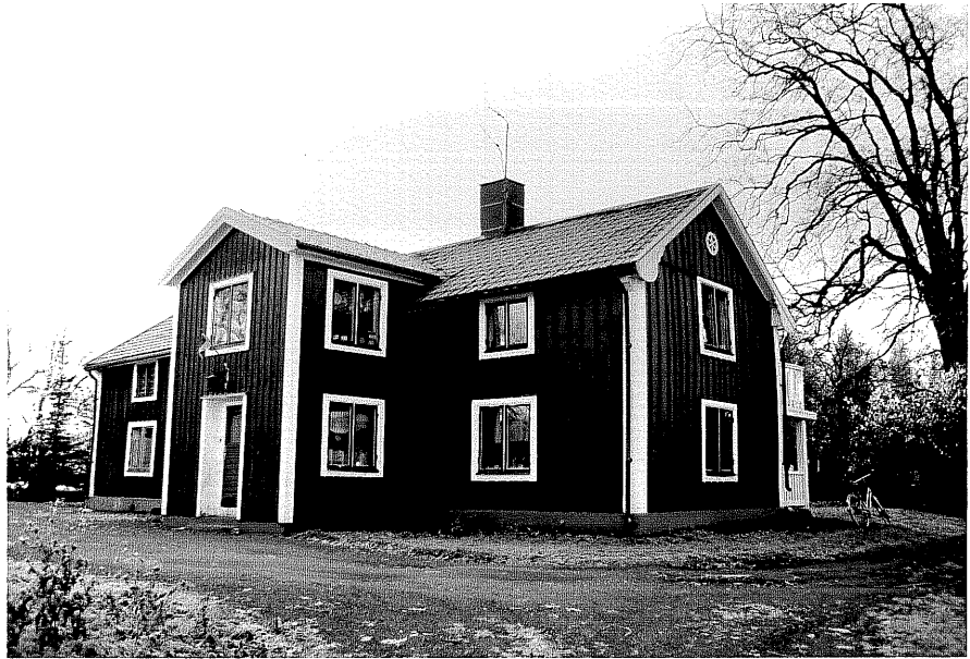
Neg. nr. T 04:01 Huvudbyggnaden från SV

Ödeshög kommun Trehörna socken Göteryd 3:2