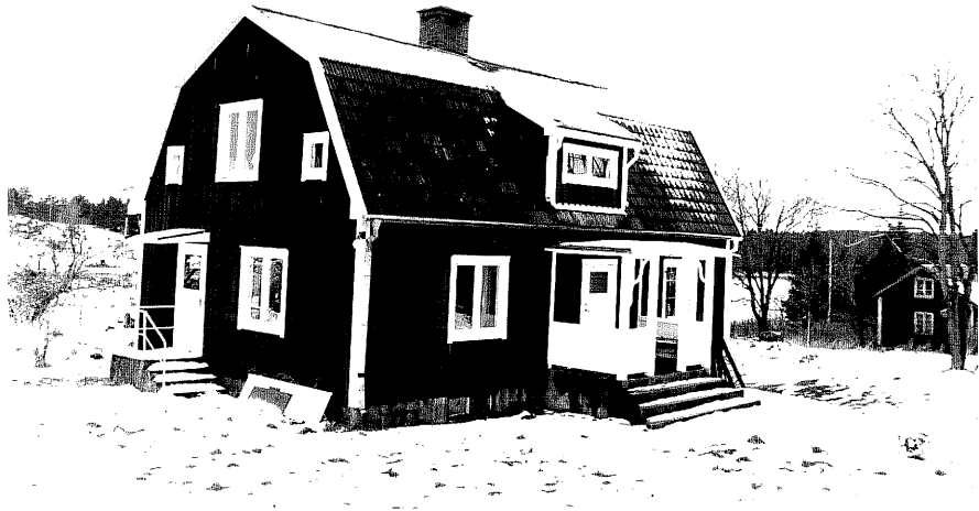
Neg. nr. T 12:27 Bostadshuset från NO

Ödeshögs kommun Trehörna socken Göteryd 3:4 Bjärsjö