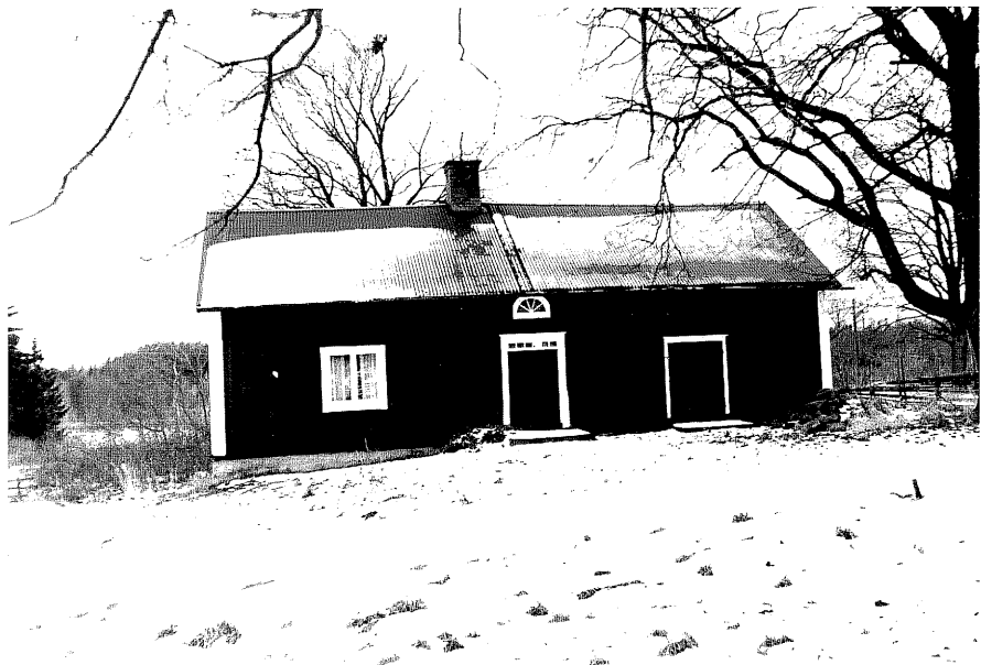
Neg. nr. T 12:28 Flygel från O