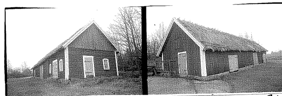
från ö 34. från S 35.