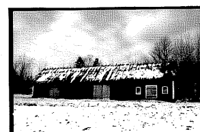
Bostadshus S 31 Bod från ö 32 Avträde S 33 Ladugård S 14.

Miljösammanhang, gårdsmiljö, trädgård fruktträd, buskar, stora lövträd.