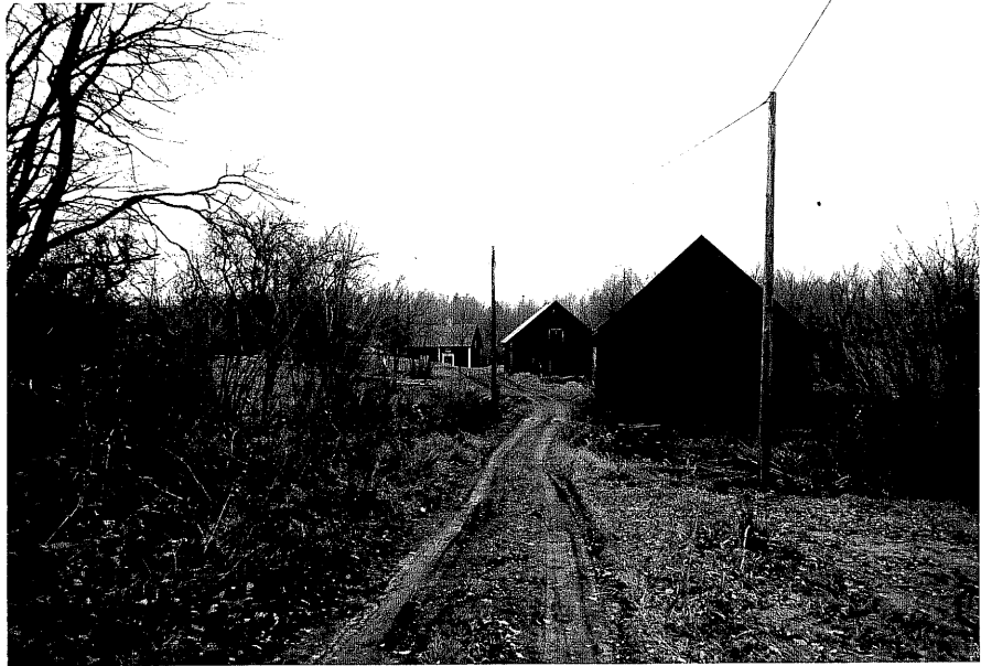
Neg. nr. T 06:28 Miljö från S

Ödeshögs kommun Trehörna socken Hallängen 1:1 Hallängen