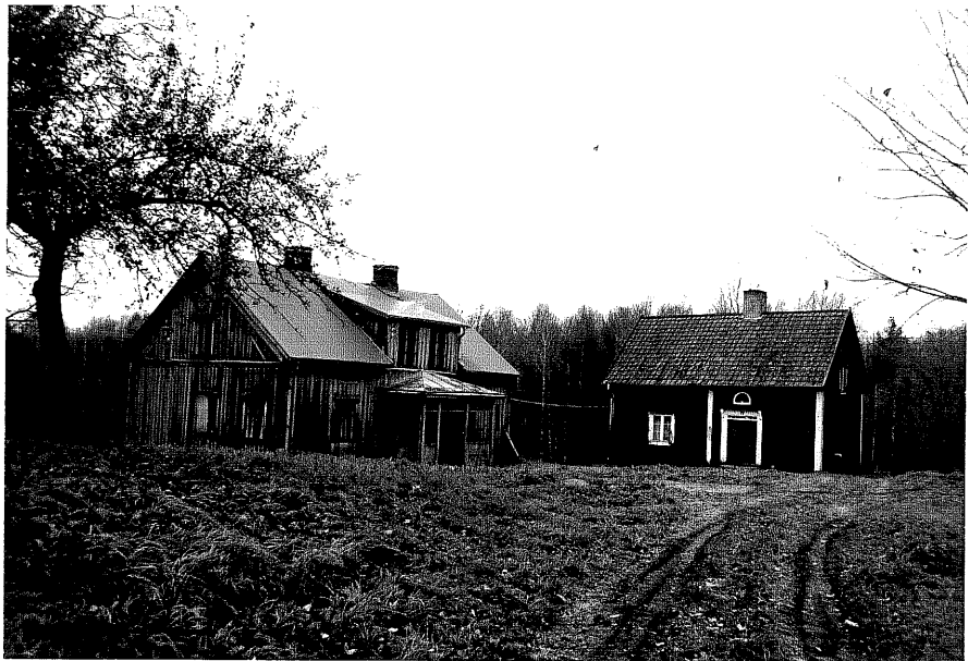
Neg. nr. T 06:35 Gårdsmiljön från SO