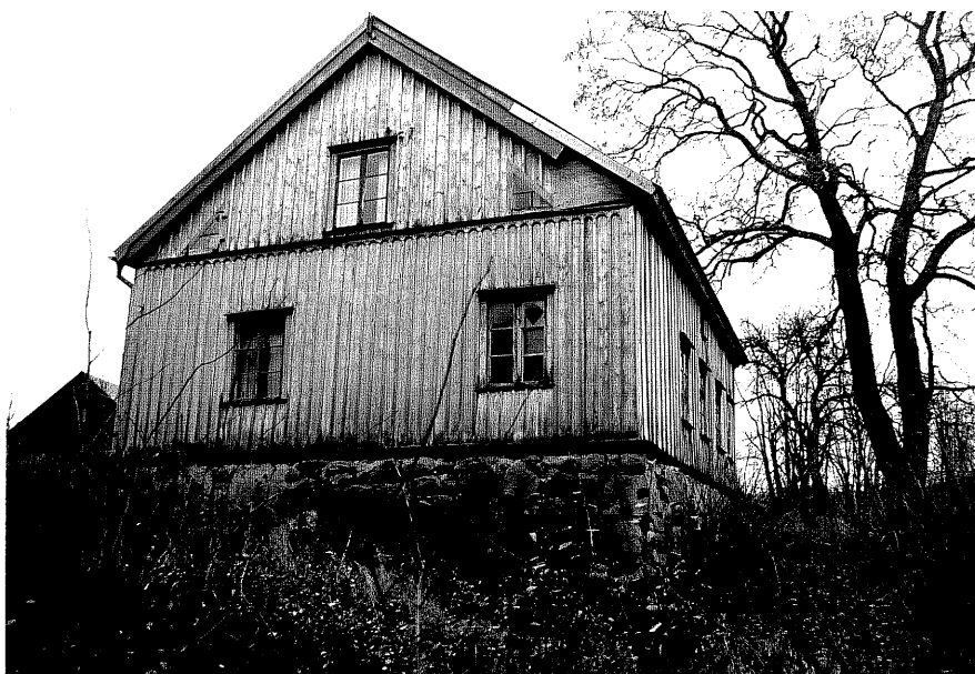
Neg. nr. T 06:34 Manbyggnaden från N