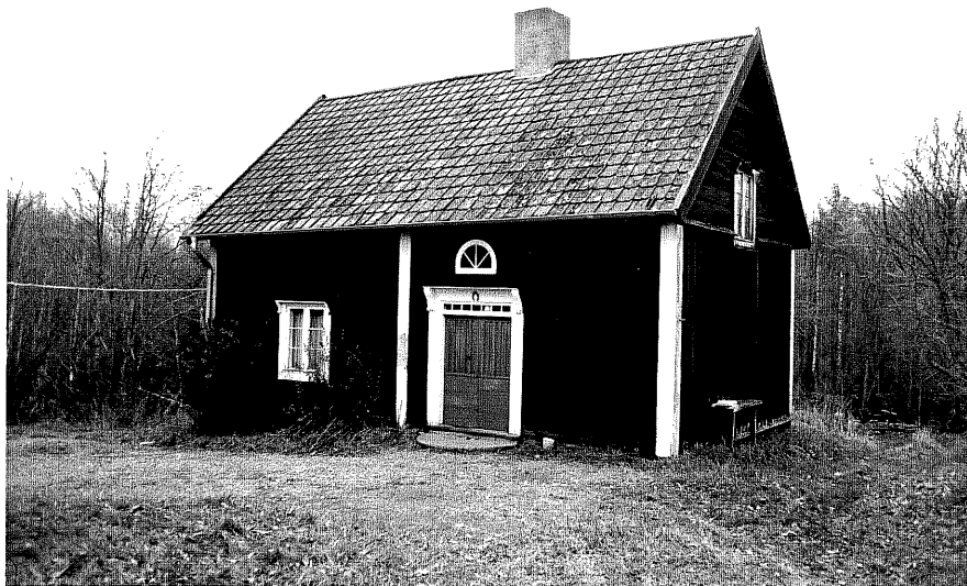
Neg. nr. T 06:30 Flygelbyggnaden från S