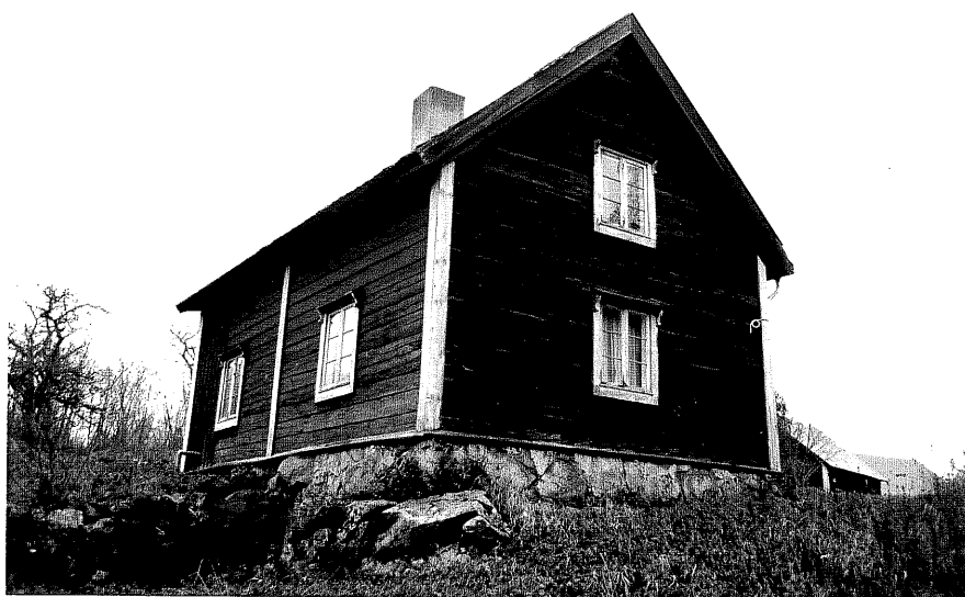
Neg. nr. T 06:33 Flygelbyggnaden från NV