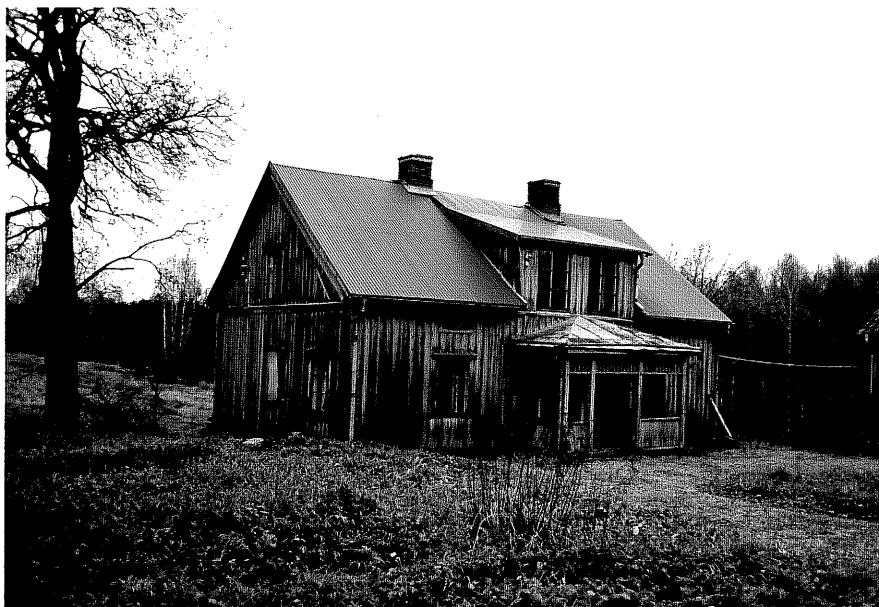
Neg. nr. T 06:29 Manbyggnad från SÖ