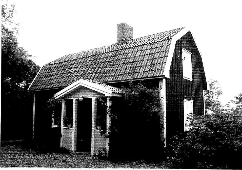
Neg. nr. V.T 06:29 Bostadshuset mot öster

Ödeshögs kommun V:a Tollstad socken Alvastra 5 1 Alvastra kvarn