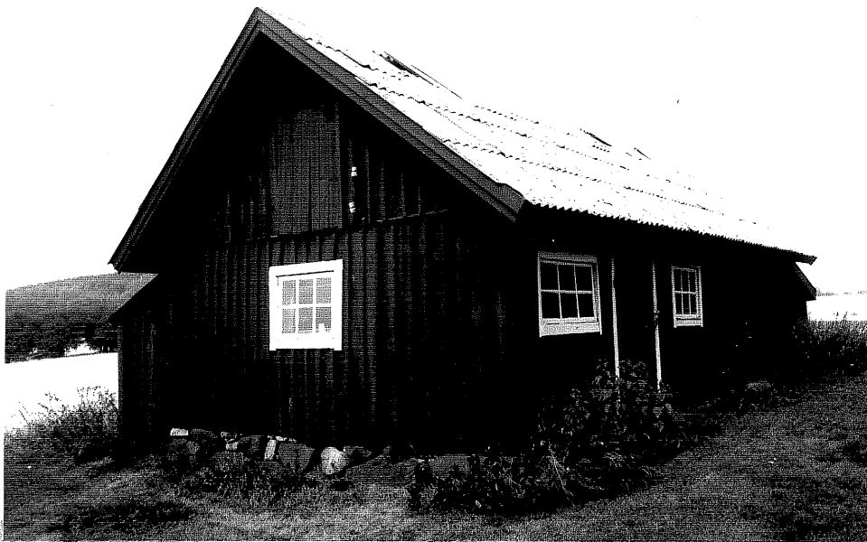
Neg. nr. V.T 06:30 Bod mot söder