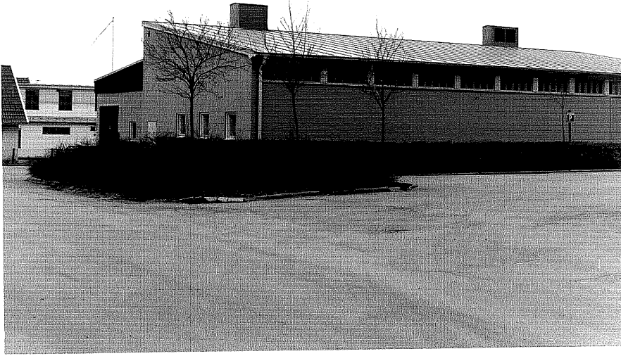
Förrådslokal fr. 0, 2:9

Ödeshög sn Handelsman Johanna 2 Pehr Brahes väg foto:M.Wikdahl,1978