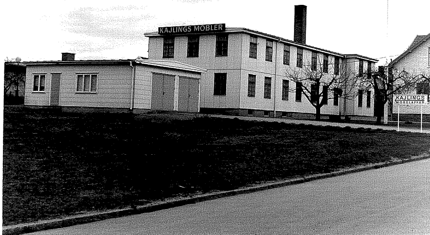
Fabrikslokal b fr.V, 2:7