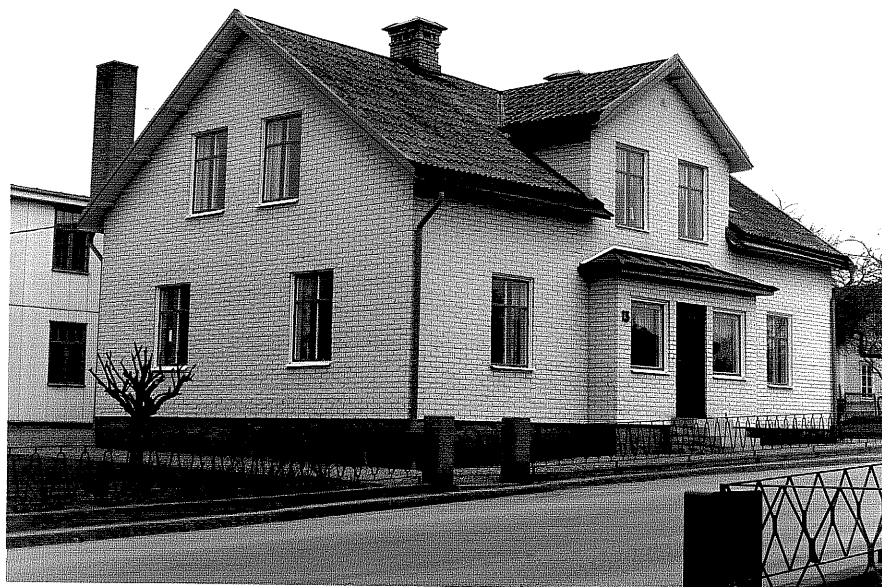
Bostadshus a fr. V, 2:6

Ödeshög sn Handelsman Johanna 5 Smedjegatan 13 foto:M.Wikdahl, 1978