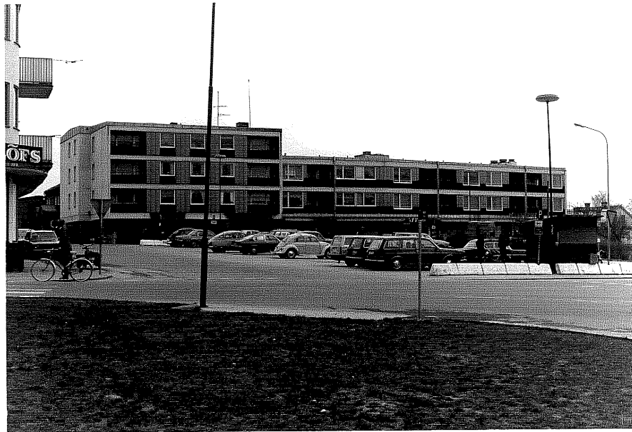
Affärs och hyreshus fr. N, 2:11