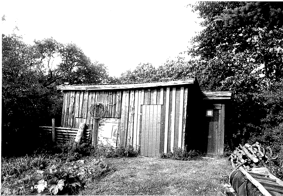
Neg. nr. V.T 06:28 Uthus mot sydost