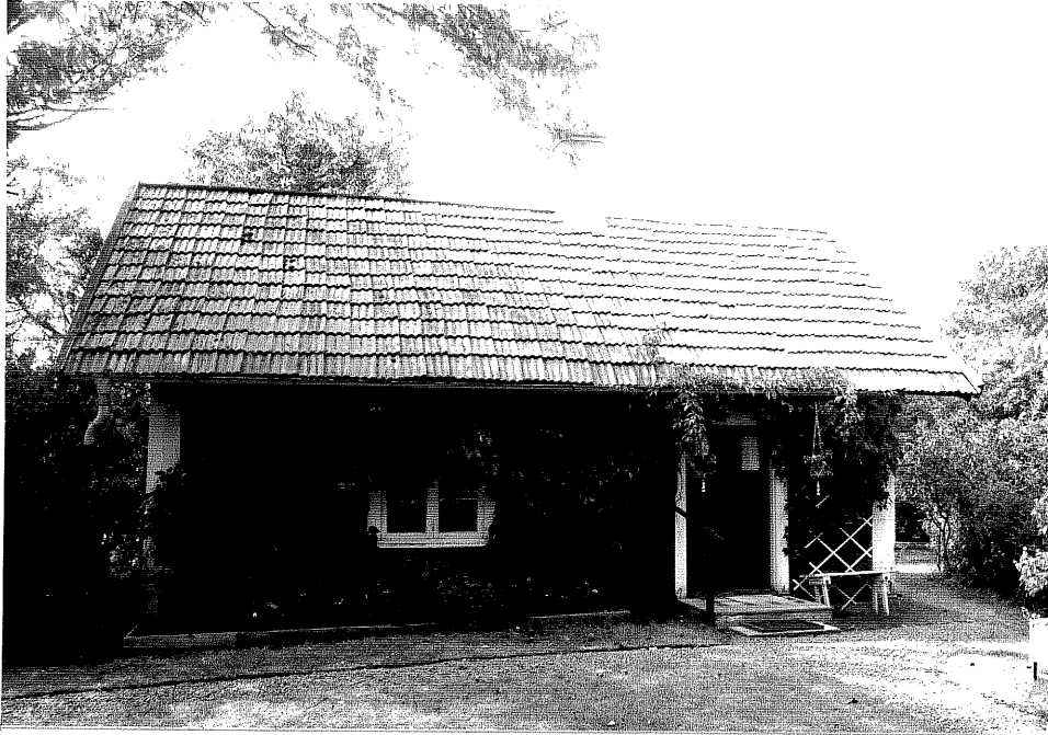
Neg. nr. V.T 06:27 Torp mot öster

Ödeshögs kommun V:a Tollstad socken Alvastra 5 1 "Ålebäck"