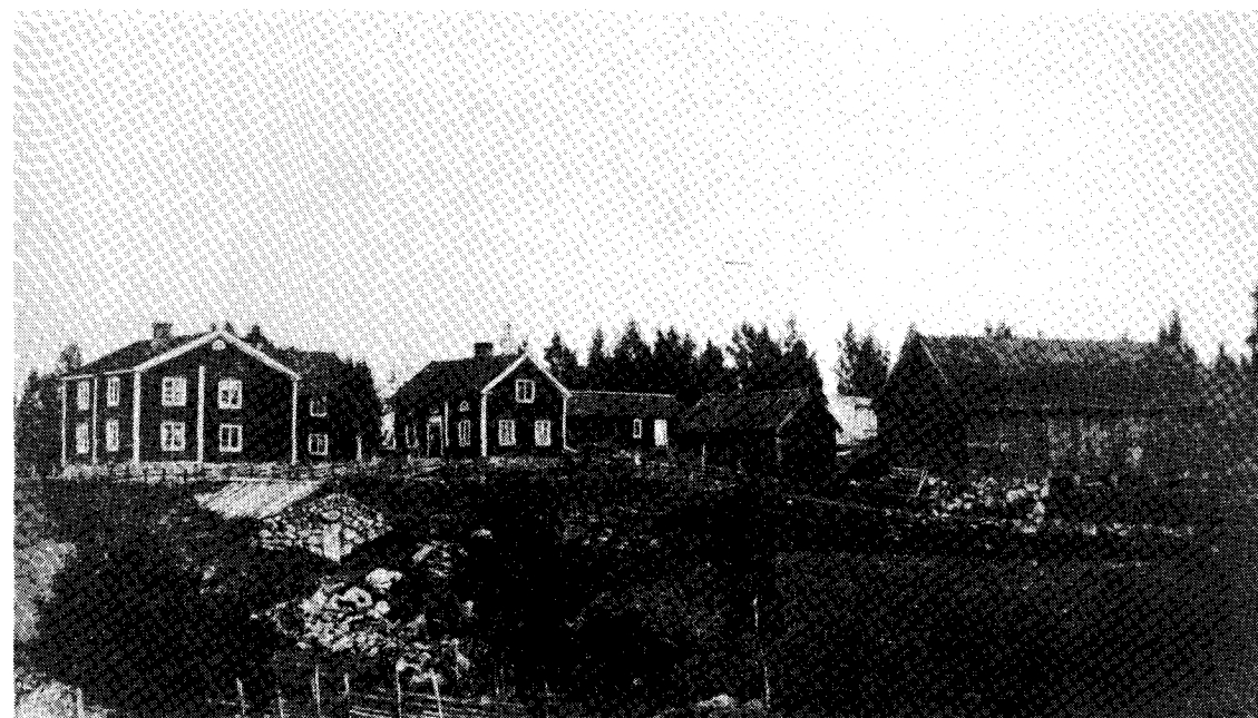
Affären i Ekeberg, Trehörna socken, startade strax efter beslutet om näringsfrihet 1846. Den var inrymd i det vänstra huset på bilden. (Foto omkr 1910)

att många gårdar flyttades ut från bykärnorna. På de lediga tomterna kom hantverkare och köpmän att flytta in. Befolkningen i området var ju stor och här fanns således avsättningsmöjligheter för hantverks- och handelsvaror. Den nuvarande tätorten Ödeshög växte alltså fram på ägor tillhörande såväl Ödeshögs som Åby byar.