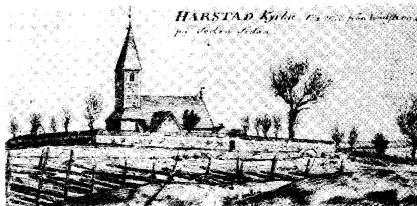
Teckning av Johan Fredrik Kock den 30 mars 1807.