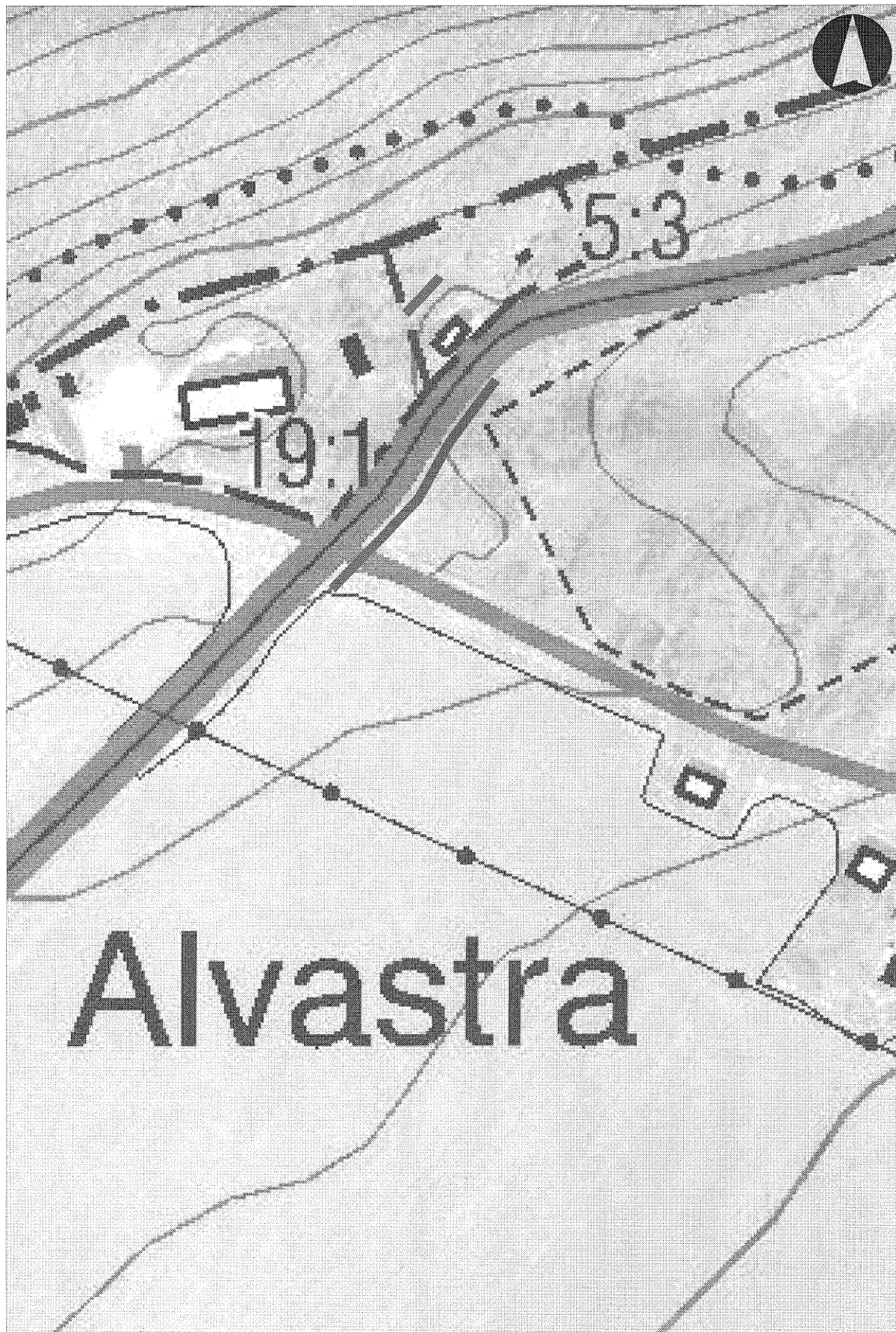
Figur 3. Utdrag ur digitala Fastighetskartan med schakten markerade. Skala 1:1 000.