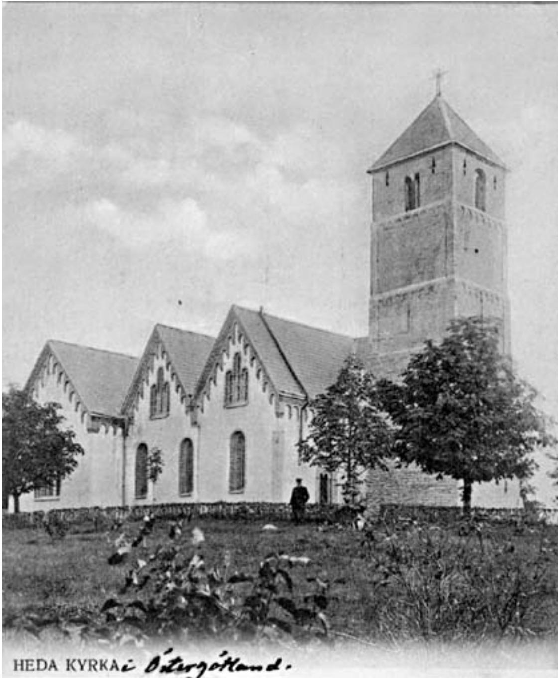
Heda kyrka år 1900.

revs och det nuvarande mycket höga och smäckra tornet uppfördes. Den nu försvunna tornhuvuden hade en för Sverige unik utformning med en stenhuv prydd med mittståndare och fyra hörnståndare. Mellan torn och långhus finns en högt placerad bågöppning, vilken idag återfinns över valven. Kyrkorummet hade ursprungligen en öppen takstol och öppningen har sannolikt fungerat som utgång till en läktare, en s k empor. Under medeltiden tillkom även en sakristia på korets norra sida samt ett vapenhus på kapellets södra sida. I kyrkan förvaras en dopfuntscuppa av sandsten, som daterats till 1200-talets första hälft. Detta kan även tyda på att kyrkan ursprungligen uppförts som en privat kyrka för en kung eller storman och först i samband med att den blev sockenkyrka anskaffades en dopfont.