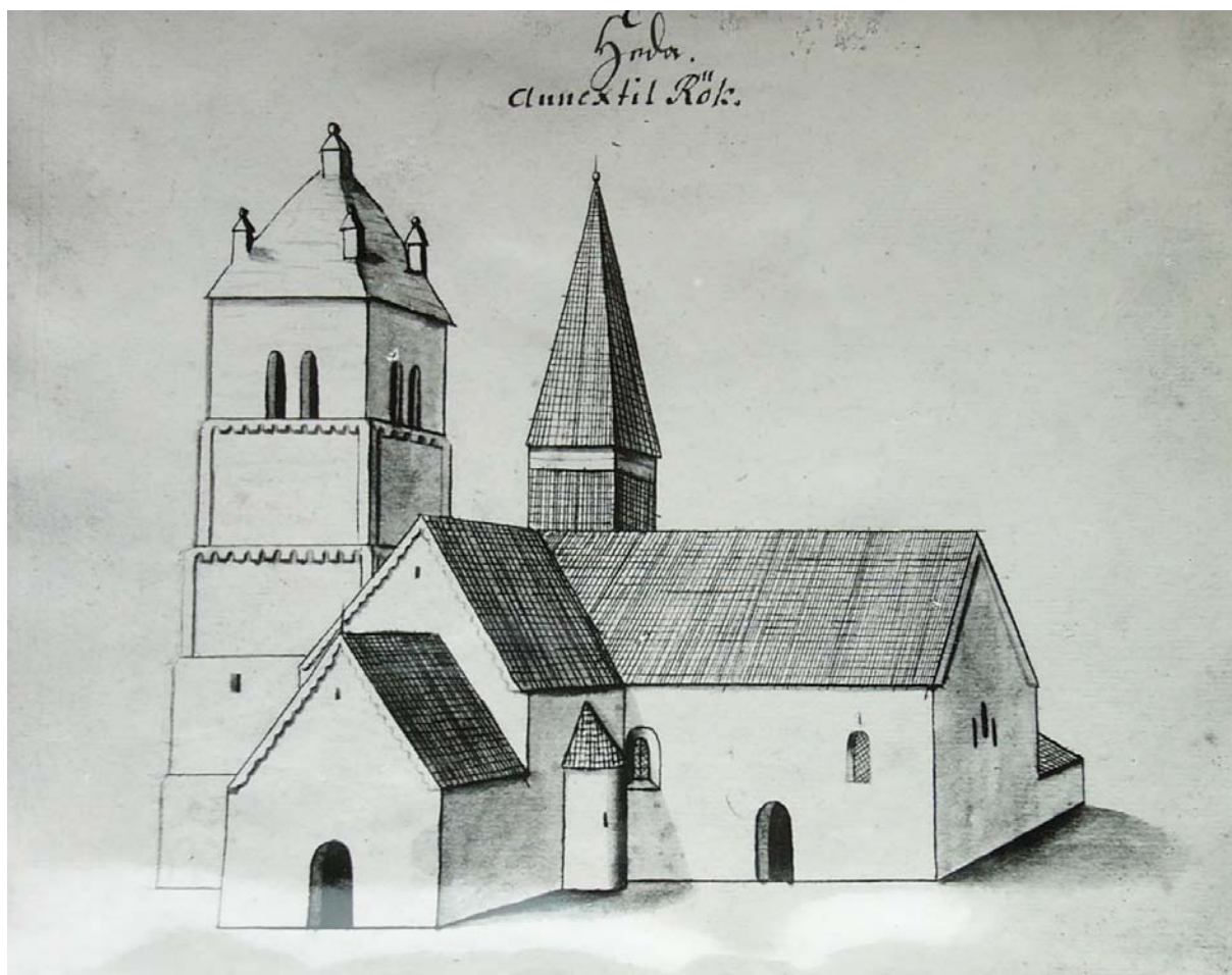
Avbildning av kyrkan från 1670-talet av Elias Brenner.