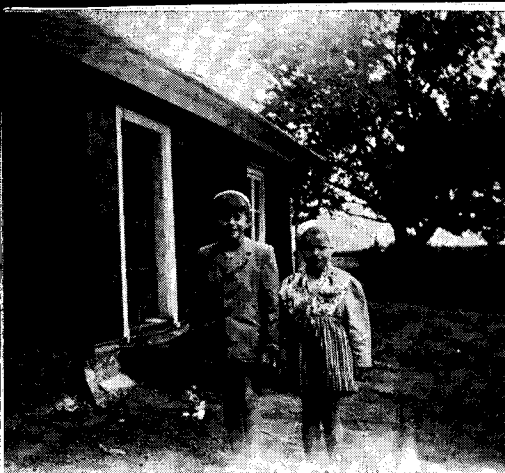
Hedaättlingar vid prästgårdsflygeln.