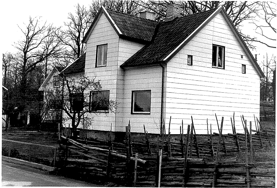
Bostadshus a fr.SV, 7:20.