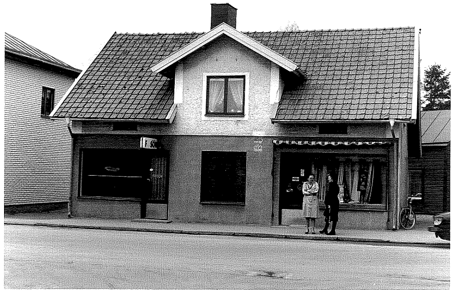
Affärs och bostadshus a fr.S,1:35

Ödeshög sn Hjälmen 5 Riddargatan 10 foto:M.Wikdahl,1978