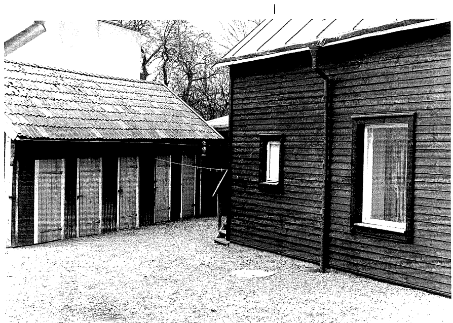
Uthus b och gårdshus till Hjälmen 6, fr. 50,1:36