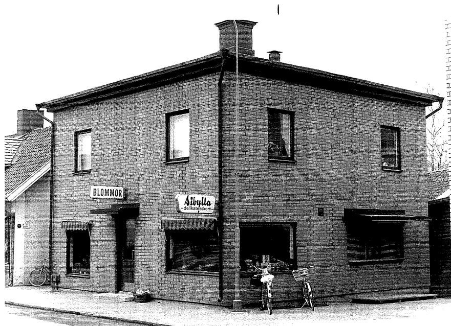
Affärs och bostadshus fr.50, 2:2

Ödeshög sn Hjälmen 6 Riddargatan 8 foto:M.Wikdahl,1978