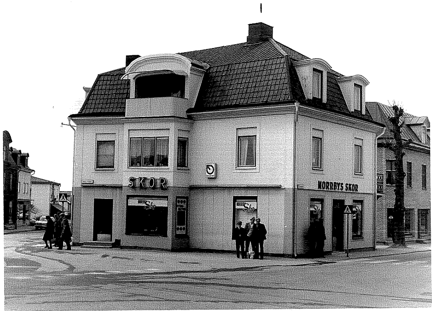
Affärs och bostadshus fr.0, 1:26

Ödeshög sn Hjälmen 9 Stora Torget foto:M.Wikdahl,1978