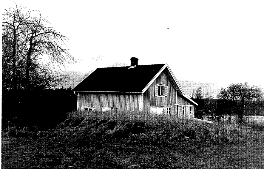
Neg. nr. T 15:37 Arbetarbostad från SO