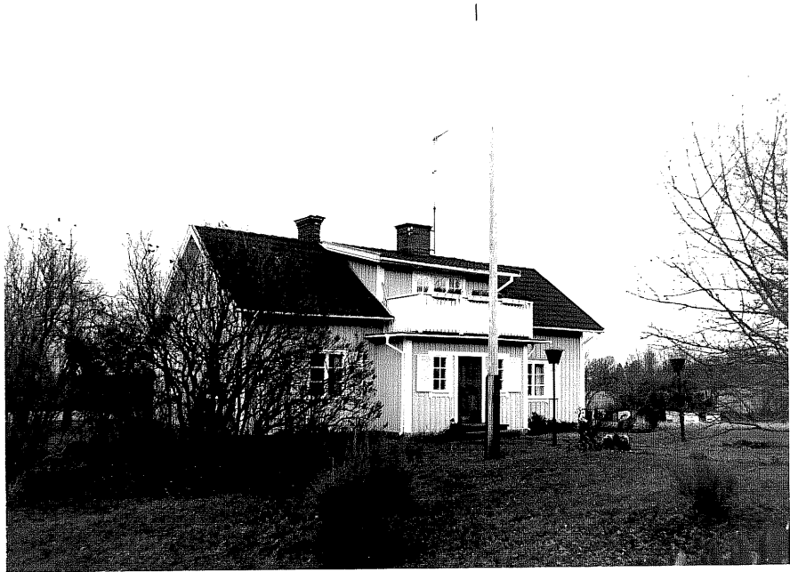
Neg. nr. T 15:38 Manbyggnaden från SV

Ödeshögs kommun Trehörna socken Hult 1:5 Västergården