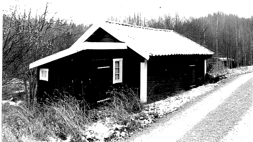
Neg. nr. T 12:07 Bod från N