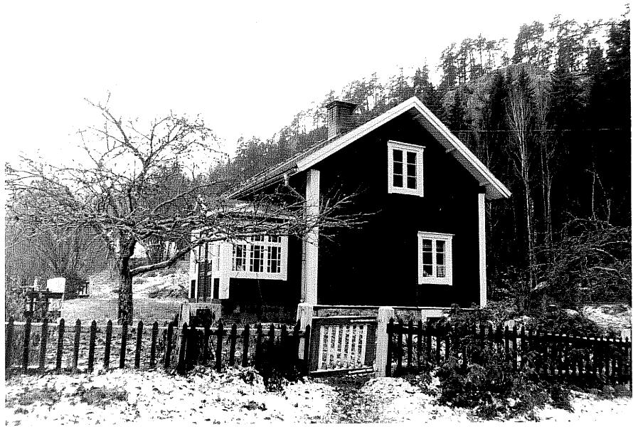
Neg. nr. T 12:06 Norra huset från NO

Ödeshögs kommun Trehörna socken Hult 1:7 Klinten