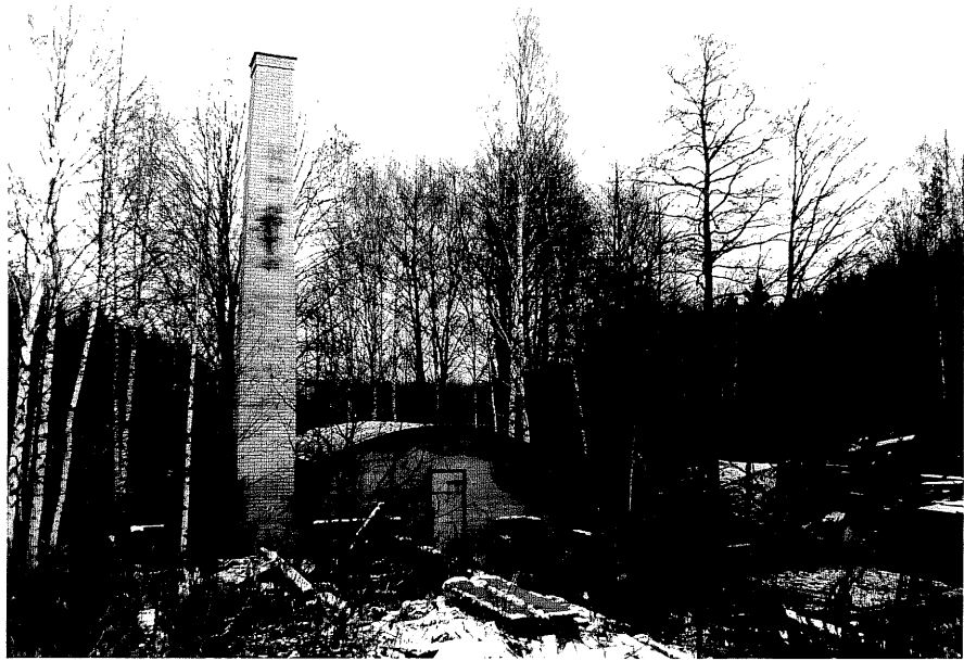
Neg. nr. T 12:10 Rester av sågen från S

Ödeshögs kommun Trehörna socken Hult 1:7 Klinten