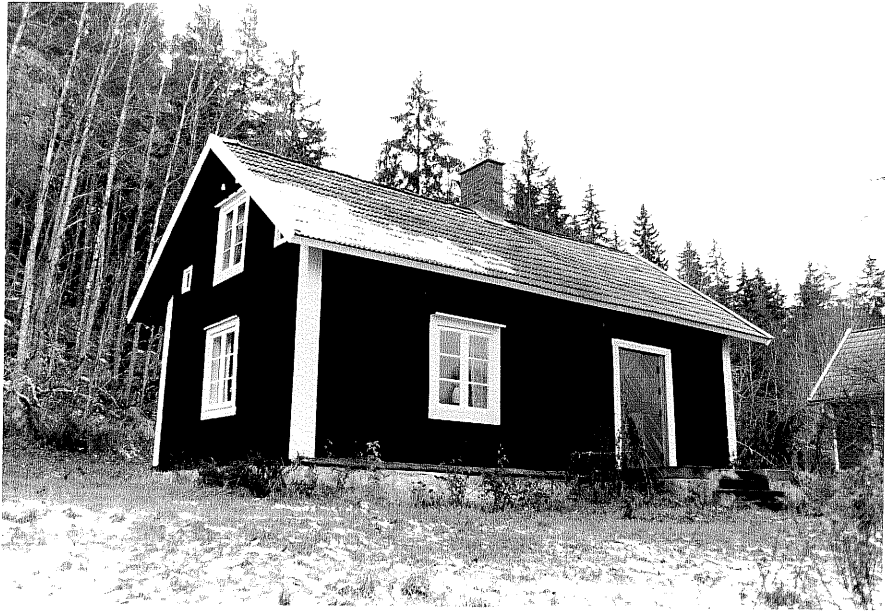
Neg. nr. T 12:03 Bostadshuset från S0

Ödeshögs kommun Trehörna socken Hult 1:7 Klinten