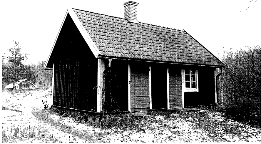
Neg. nr. T 12:05 Bod från SV

Ödeshögs kommun Trehörna socken Hult 1:7 Klinten