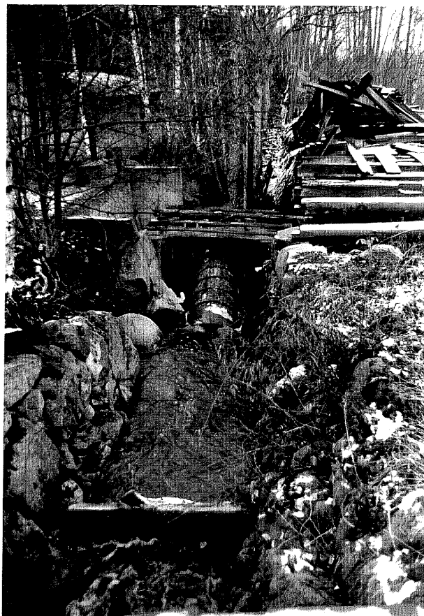
Neg. nr. T 12:09 F.d. kvarnstället från N