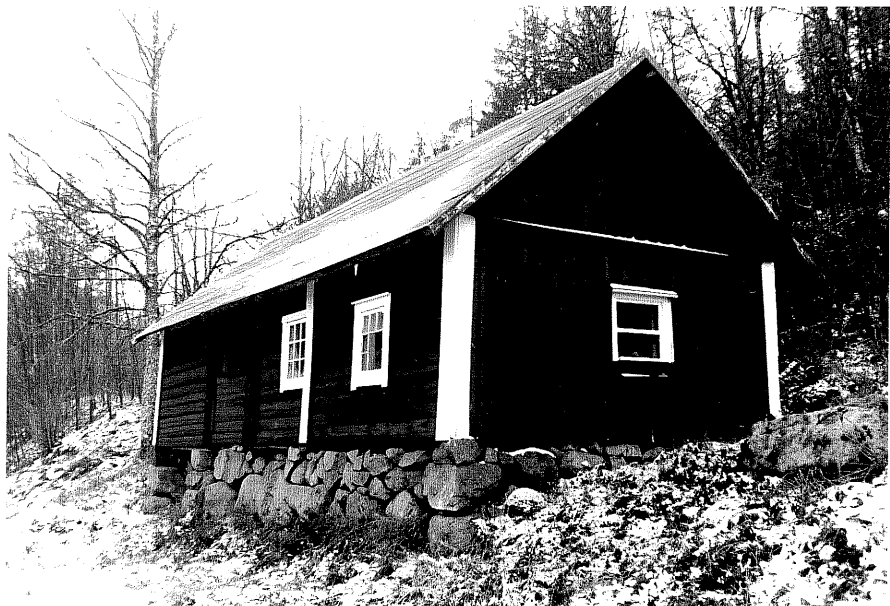
Neg. nr. T 12:04 F.d. ladugård från N0