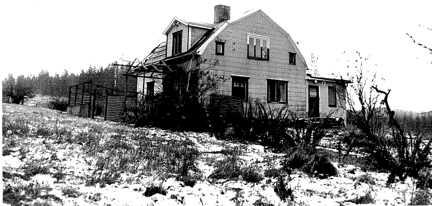
Neg. nr. T 12:11 Madfällan från NO

Ödeshögs kommun Trehörna socken Hult 1:8 Madfällan