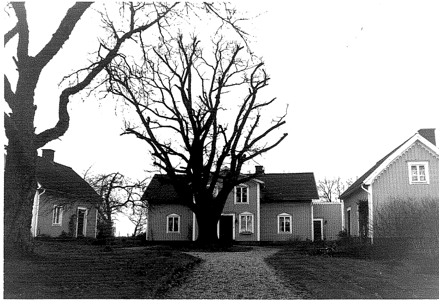
Neg. nr. T 15:34 Mellangården i miljön från 0

Ödeshögs kommun Trehörna socken Hult 1:9 Mellangården