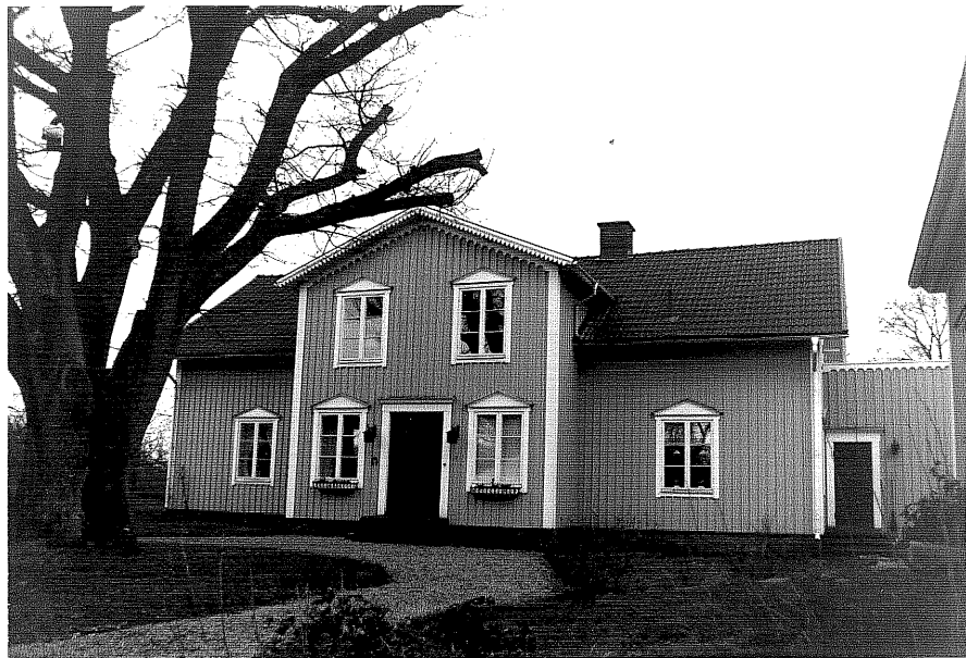
Neg. nr. T 15:31 Manbyggnaden från 0