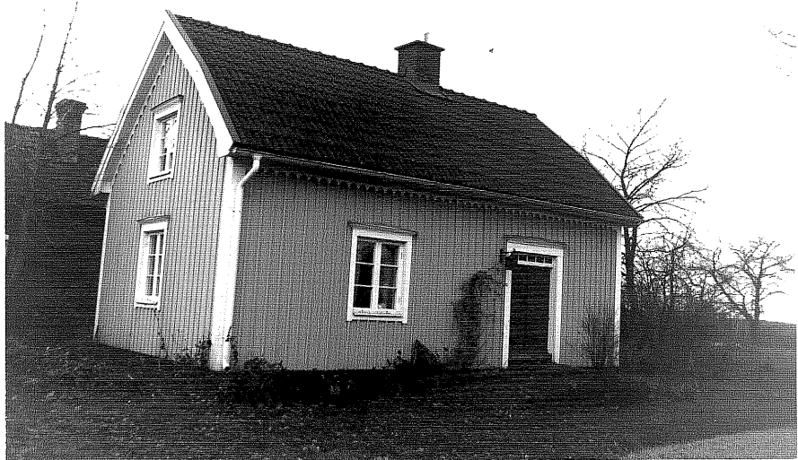
Neg. nr. T 15:32 Södra flygeln från N0