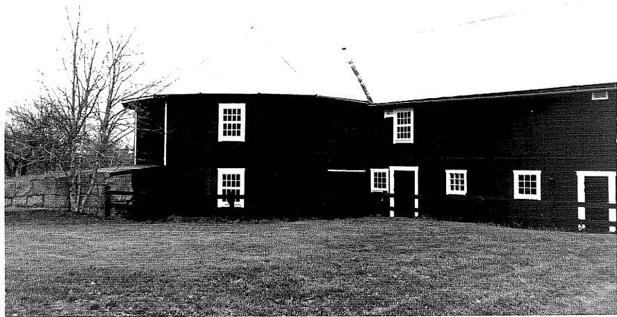
Neg. nr. T 15:36 Ladugården med rundloge från SV