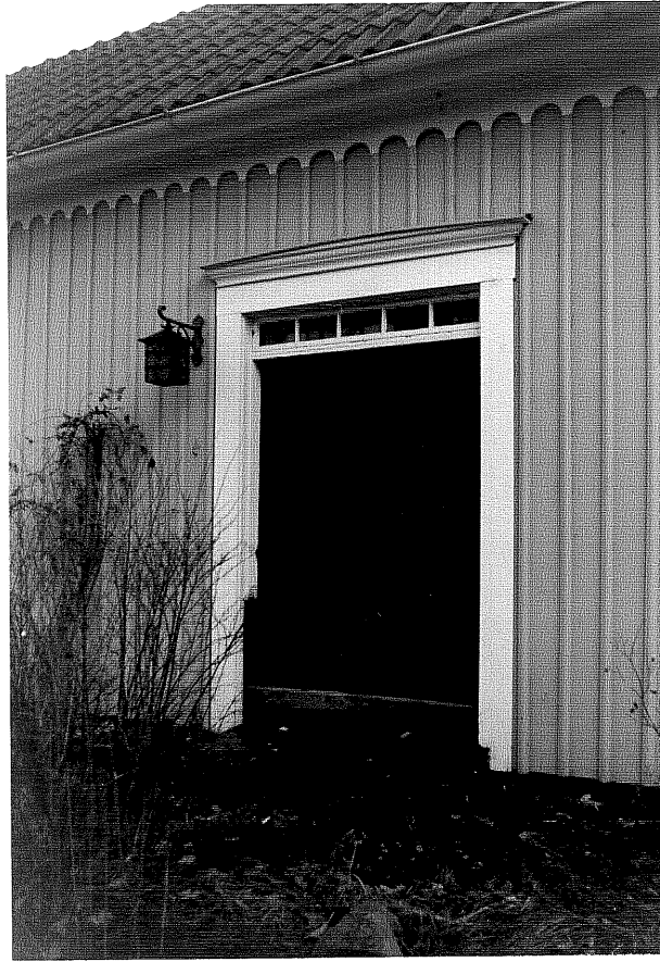
Neg. nr. T 15:35 Södra flygelns dörr

Ödeshögs kommun Trehörna socken Hult 1:9 Mellangården