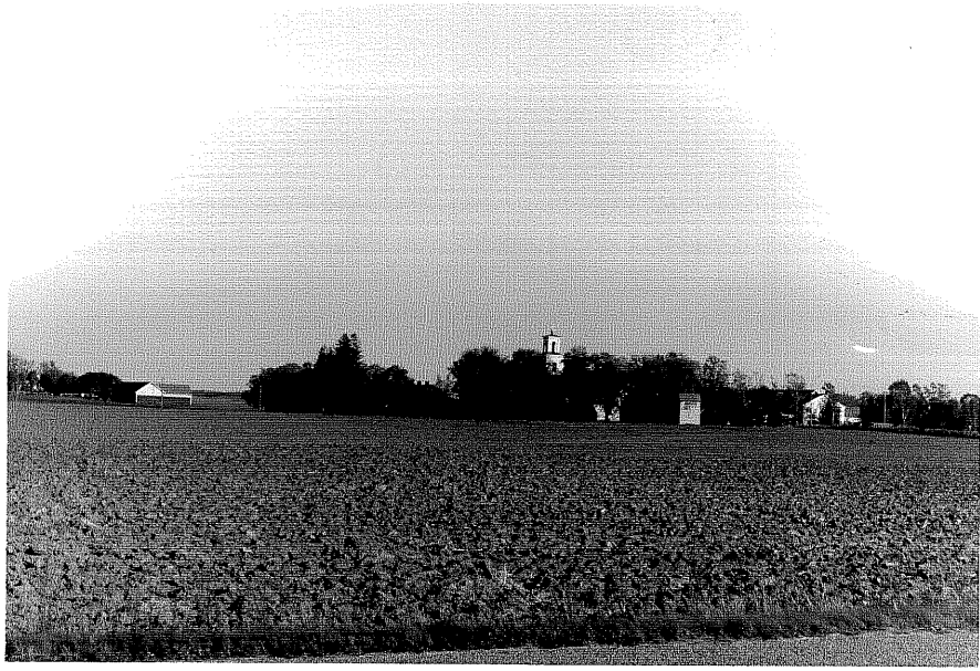
Neg nr ÖKM 14:10 Miljö från V

Ödeshögs kommun V Tollstad socken V Tollstad kyrkby