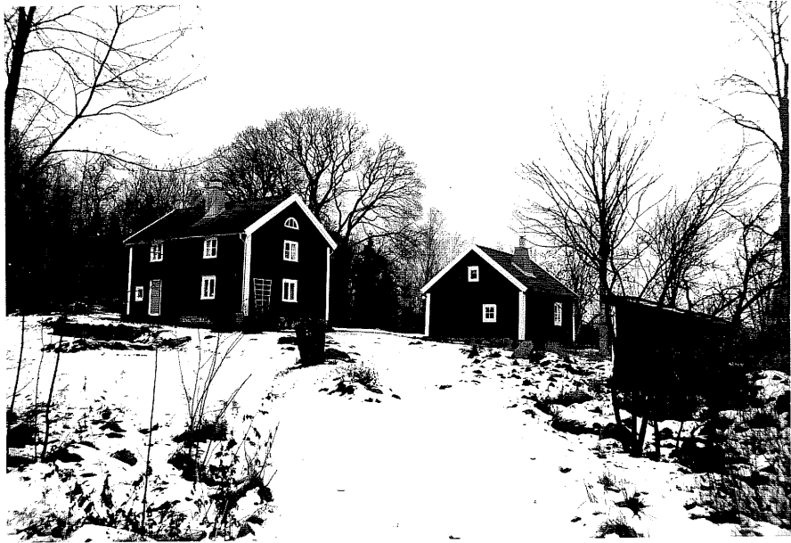
Neg. nr. T 13:23 Västergården i miljön från SV

Ödeshögs kommun Trehörna socken Hålan 1:10 Västergården