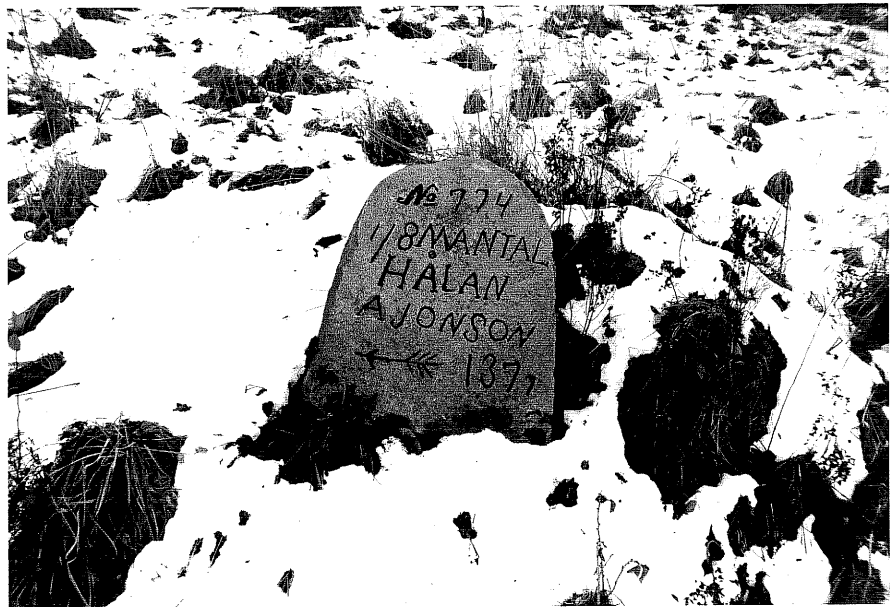
Neg. nr. T 13:24 Upplyningssten från V