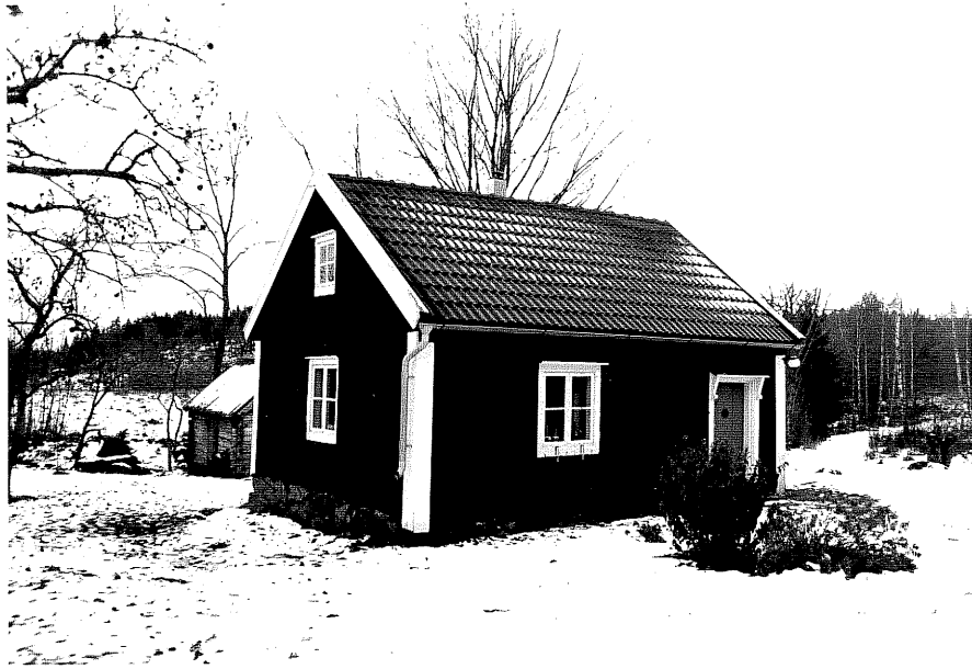
Neg. nr. T 13:27 Gäststuga från NO