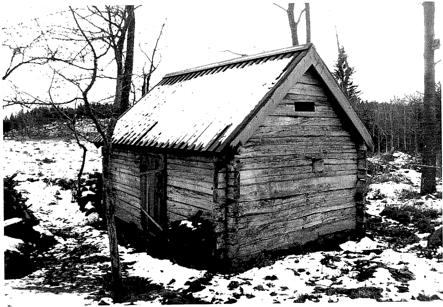
Neg. nr. T 13:29 Timrad bod från NO

Ödeshögs kommun Trehörna socken Hålan 1:10 Västergården