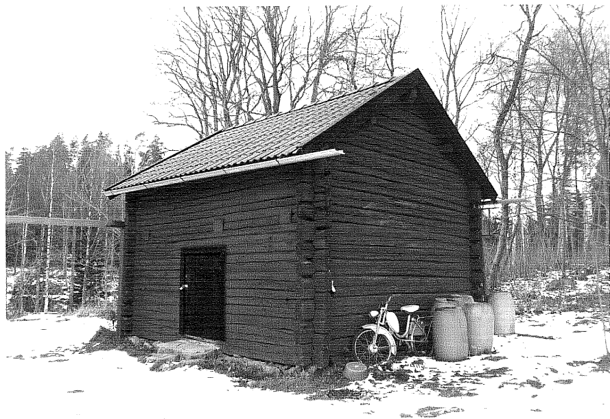
Neg. nr. T 13:28 Visthusbod från SO