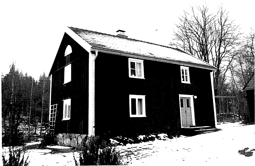
Neg. nr. T 13:26 Manbyggnaden från SO