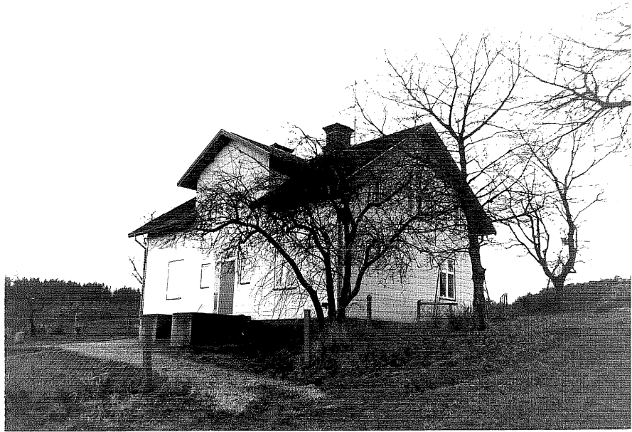
Neg. nr. T 15:28 Södergården från NO

Ödeshögs kommun Trehörna socken Hålan 1:11 Södergården