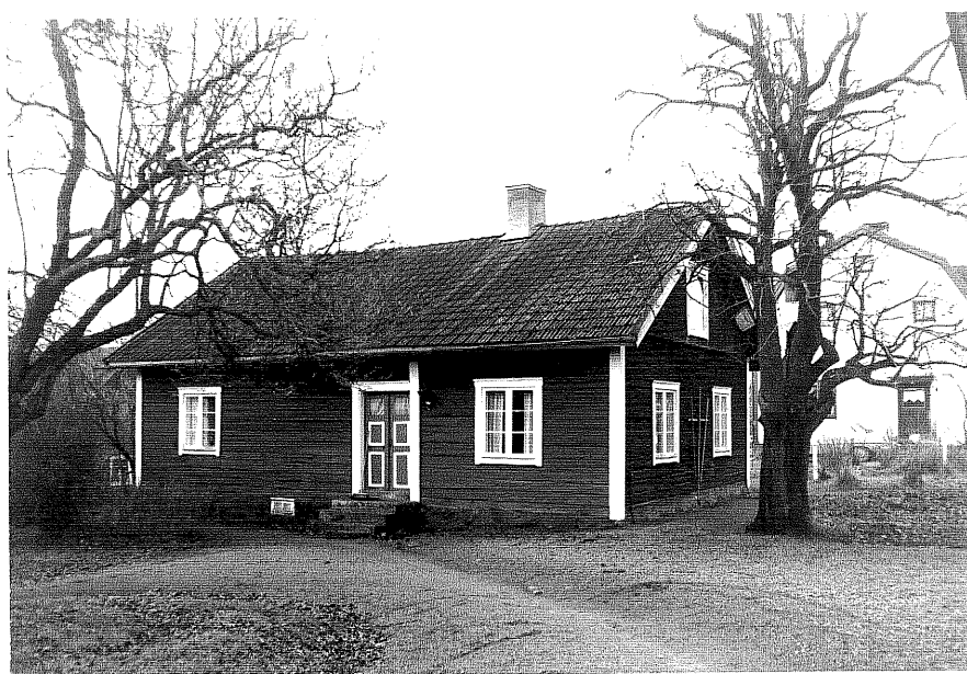
Neg. nr. T 15:26 Flygel från NV