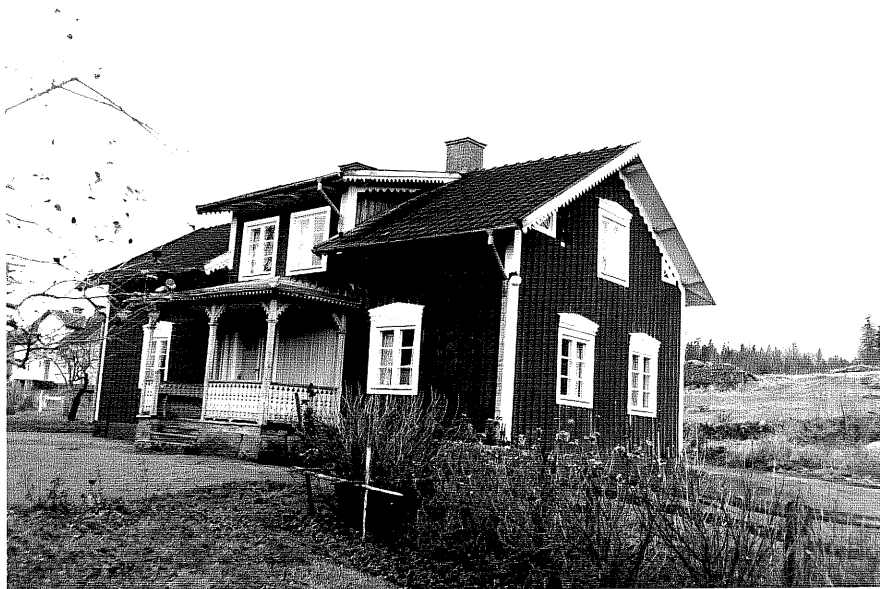
Neg. nr. T 15:25 Manbyggnaden från NO

Ödeshögs kommun Trehörna socken Hålan 1:5 Norrgården