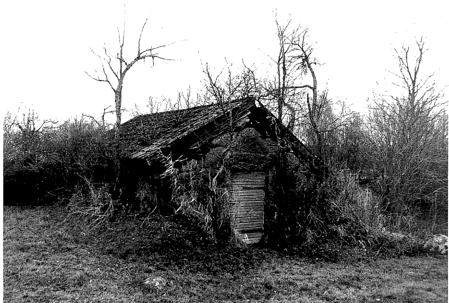
Neg. nr. T 15:24 Jordkällare från NV