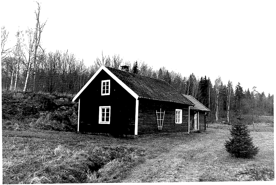
Neg. nr. T 15:27 Sommarbostad från S

Ödeshögs kommun Trehörna socken Hålan 1:5 Norrgården