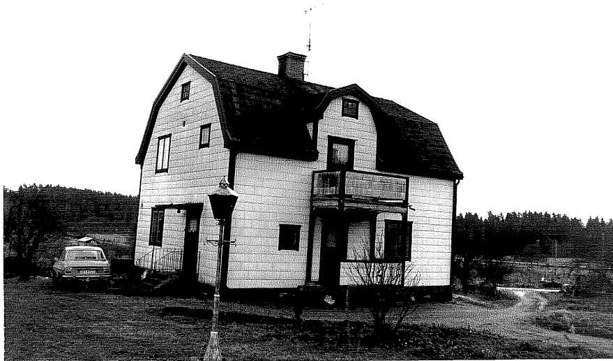
Neg. nr. T 15:22 Bostadshuset från NV

Ödeshögs kommun Trehörna socken Hålan 1:116 Mellangården