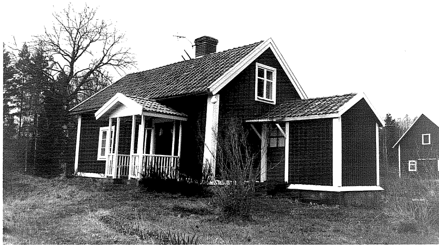
Neg. nr. T 15:29 Sommarbostaden från NO

Ödeshögs kommun Trehörna socken Hålan 1:8 Östergården