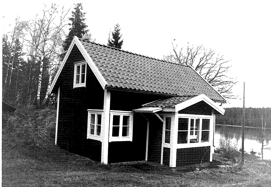
Neg. nr. T 15:30 Gäststugan från SV