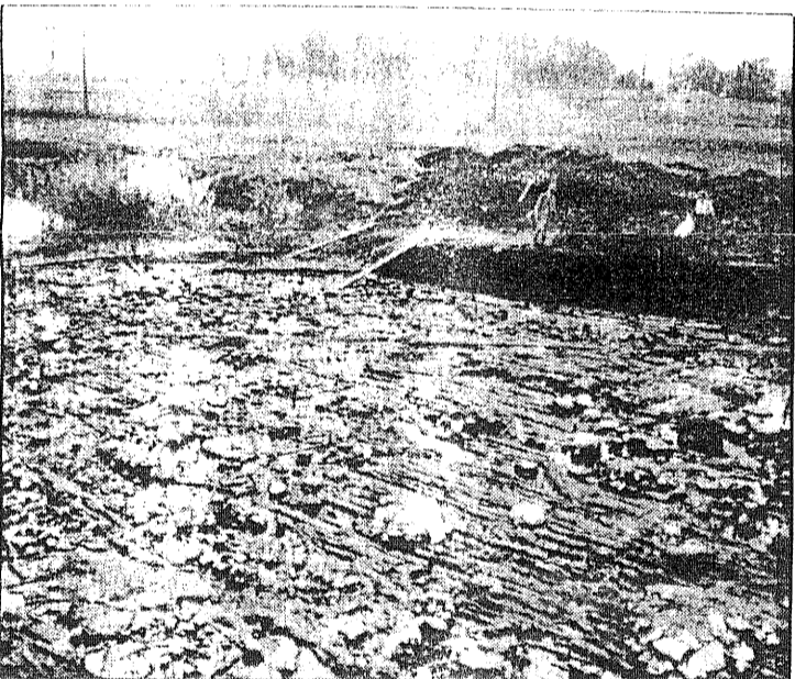
● Alvastra pålbyggnad som den såg ut frilagd vid en av de första utgrävningarna.

stenåldersfolket lämnade det. Med moderna metoder har de välbevarade stockarna daterats till 3 000 år före Kristus.