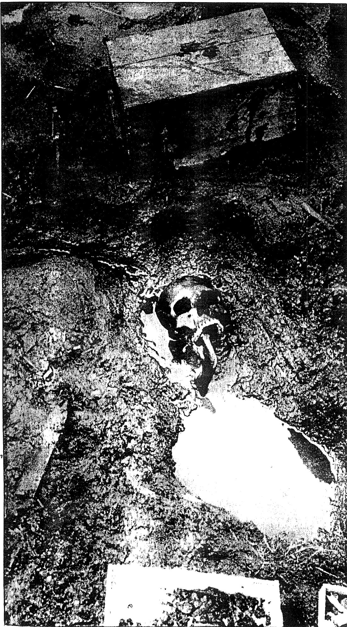
● En 5000 år gammal svensk och östgöte, bevarad från den sluffas i pålverkets historia när det användes som begravningsplats.

I mitten av 1800-talet upptäckte man det första europeiska pålverket som plötsligt visade sig ovanför ytan när vattenstån-