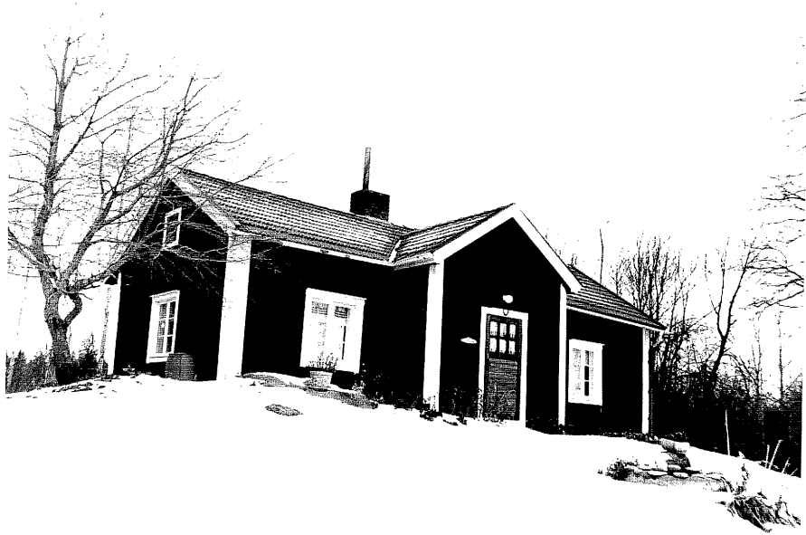
Neg. nr. T 12:36 Lakabäcken från SV

Ödeshögs kommun Trehörna socken Hägna 1:1 Lakabäcken