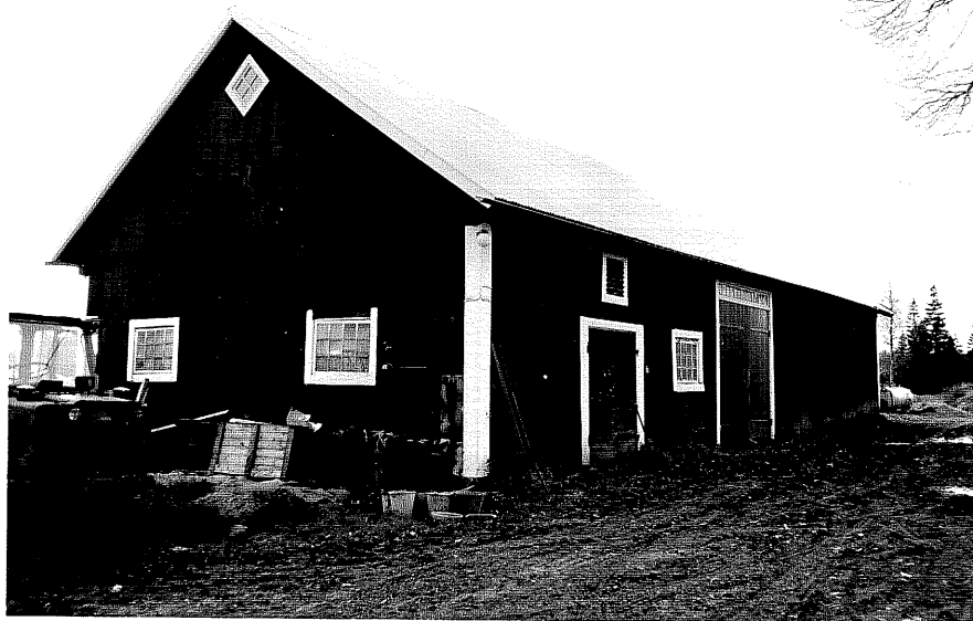
Neg. nr. T 02:17 Ladugården från NO