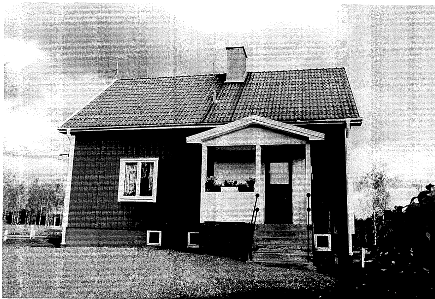
Neg. nr. T 02:10 Manbyggnaden från V