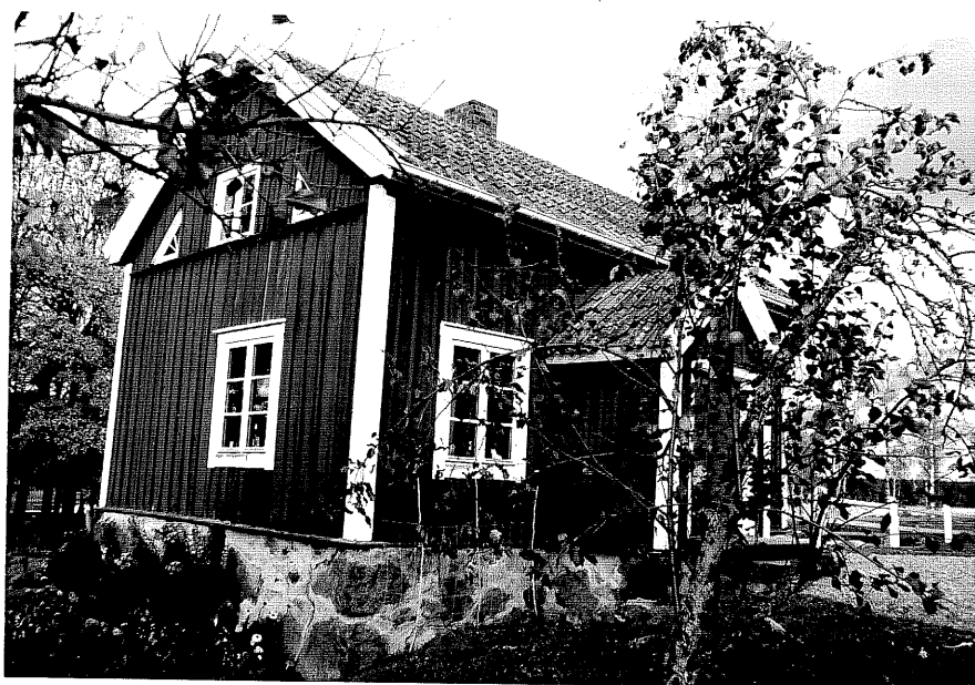
Neg. nr. T 02:14 Flygelbyggnaden från SV