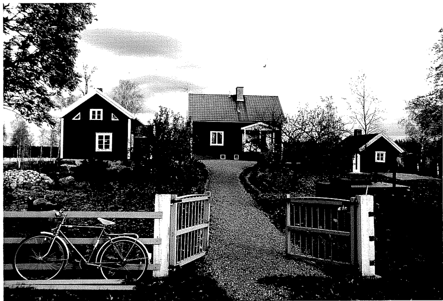
Neg. nr. T 02:16 Hässlesund från V