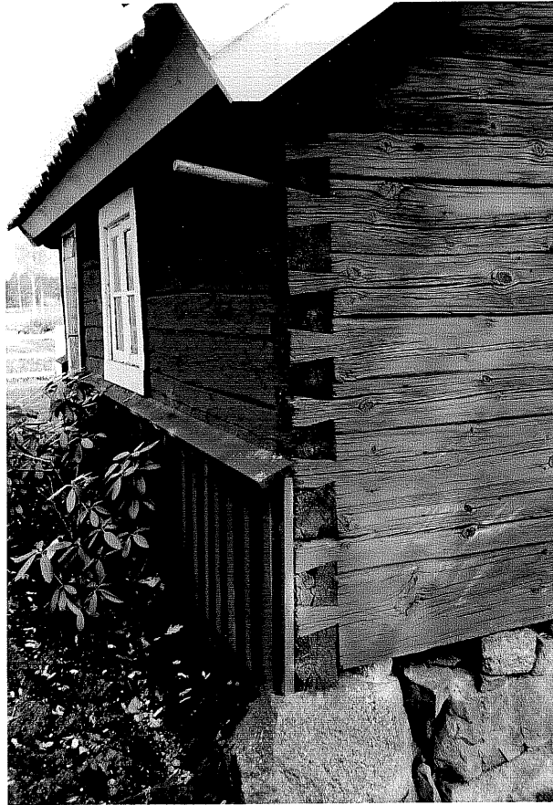
Neg. nr. T 02:12