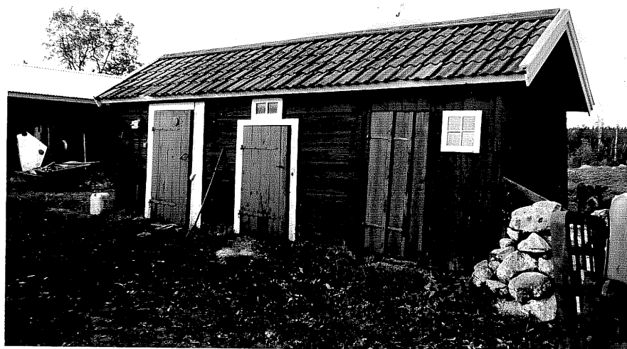
Neg. nr. T 02:18 Bod från SO