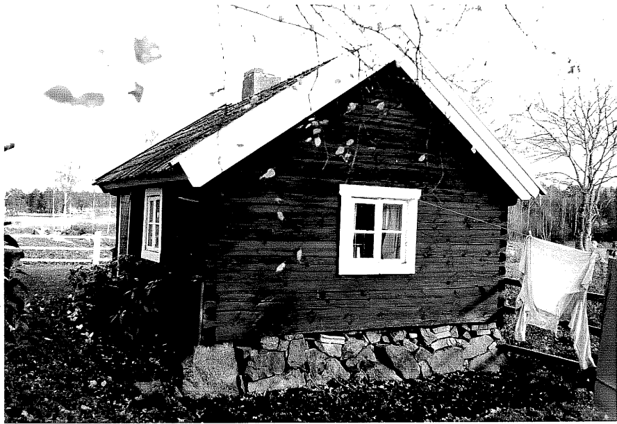
Neg. nr. T 02:11 Flygelbyggnad från V