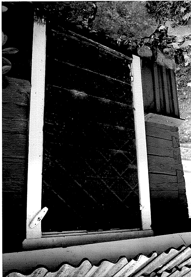
Neg. nr. T 02:13 Flygelbodens dörr från NV