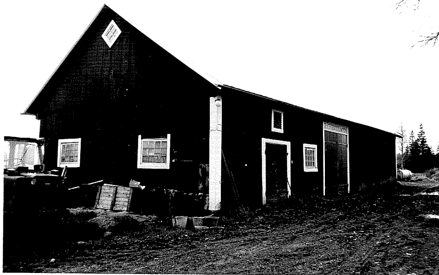
Neg. nr. T 02:17 Ladugården från NO