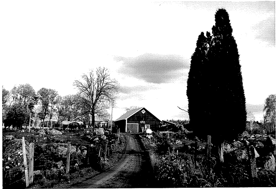
Neg. nr. T 02:22 Hässlesund i miljön från V

Ödeshög kommun Trehörna socken Hässlesund 1:1 Hässlesund