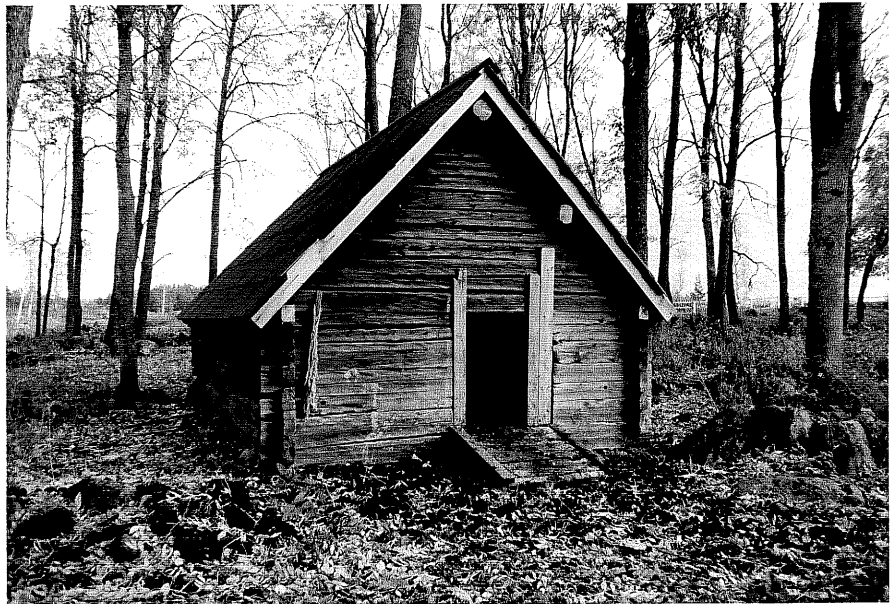
Neg. nr. T 02:21