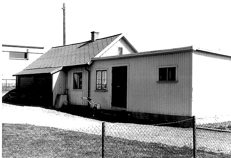
Uthus b och c fr.NV, 12:12.