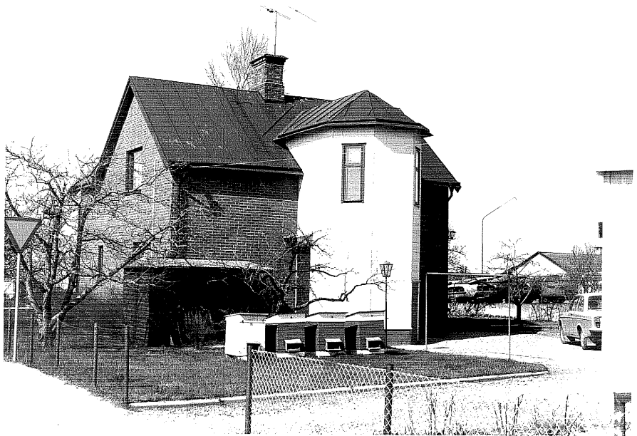
Bostadshus a fr.SV, 12:11.