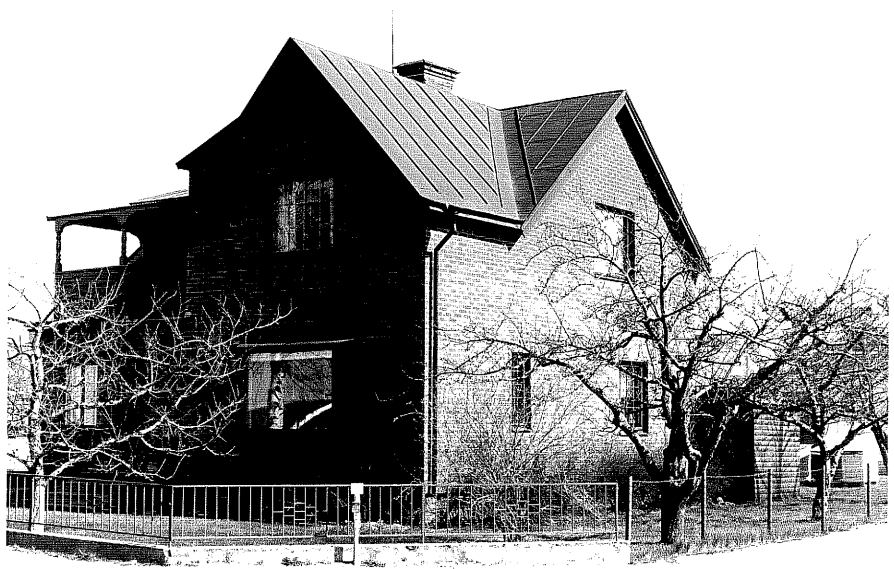
Bostadshus a fr.NV, 12:13.

Ödeshög sn Hästen 2 Storgatan 59 foto:M.Wikdahl,1978.