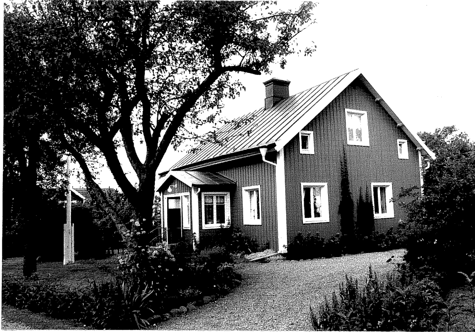
Neg. nr. V.T 05:7 Bostadshuset mot sydost.

Ödeshögs kommun V:a Tollstad socken Hästholmen Västergård 2 4 Sjöviksvägen 2