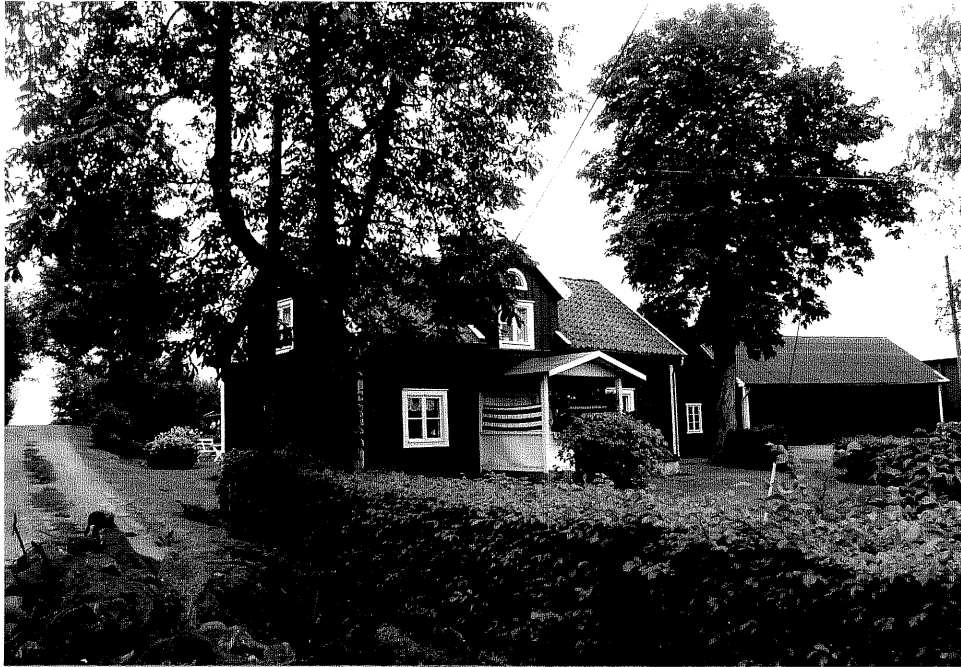
Neg. nr. V.T 04:20 F.d arbetarbostad mot norr