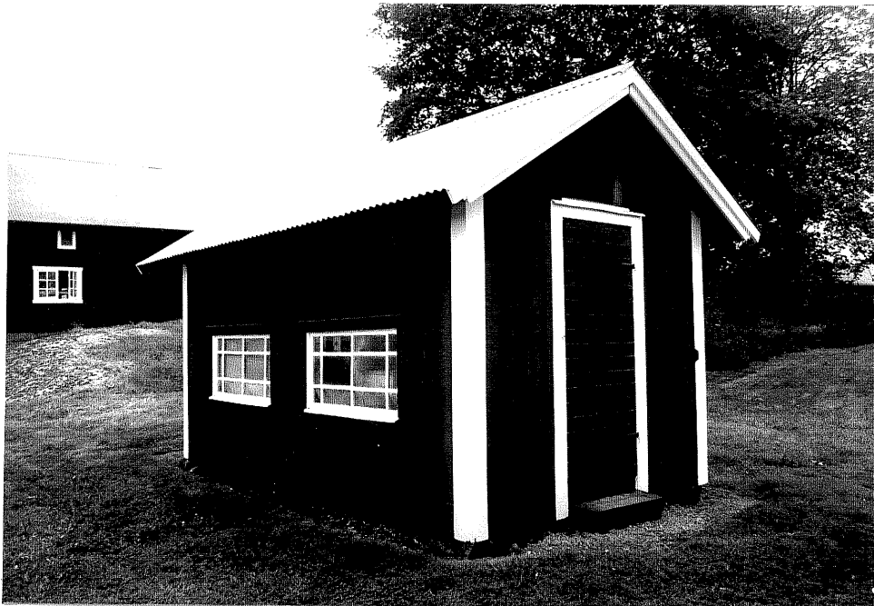
Neg. nr. V.T 04:30 Hönshus mot nordöst