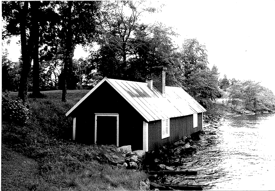
Neg. nr. V.T 04:26 Tvättstuga mot sydost