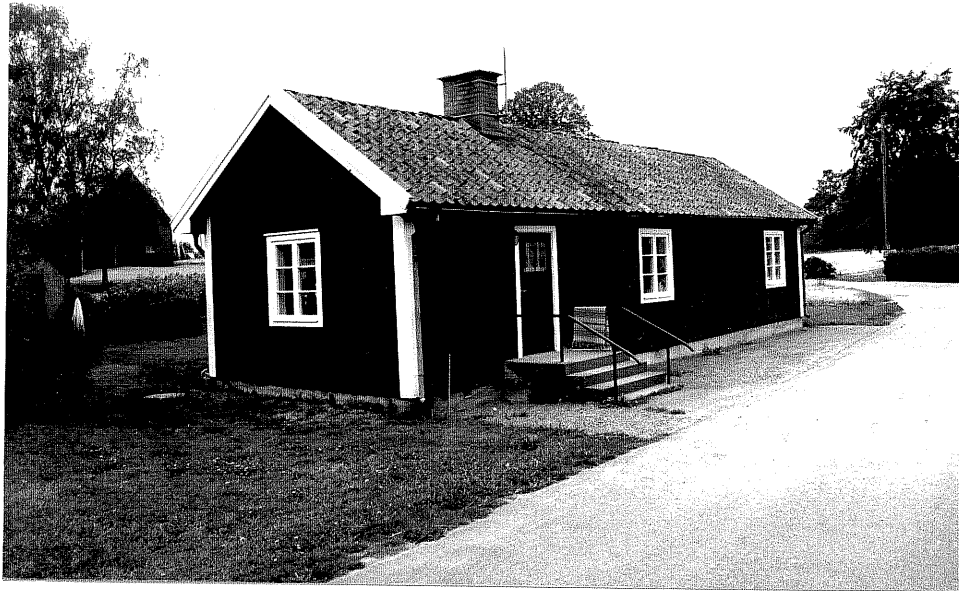
Neg. nr. V.T 04:31 F.d arbetarbostad mot öster