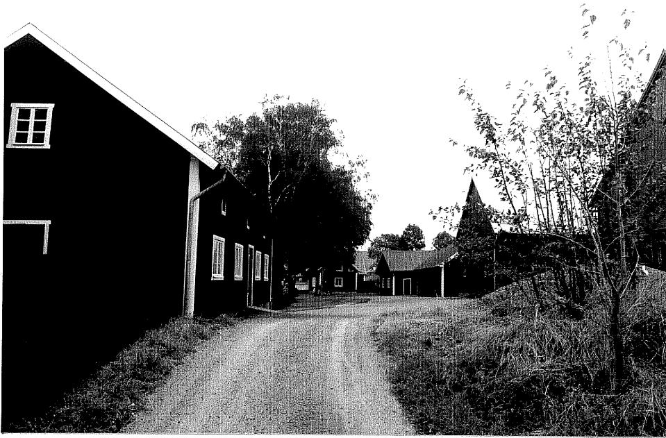
Neg. nr. V.T 04: 22 Miljöbild mot väster