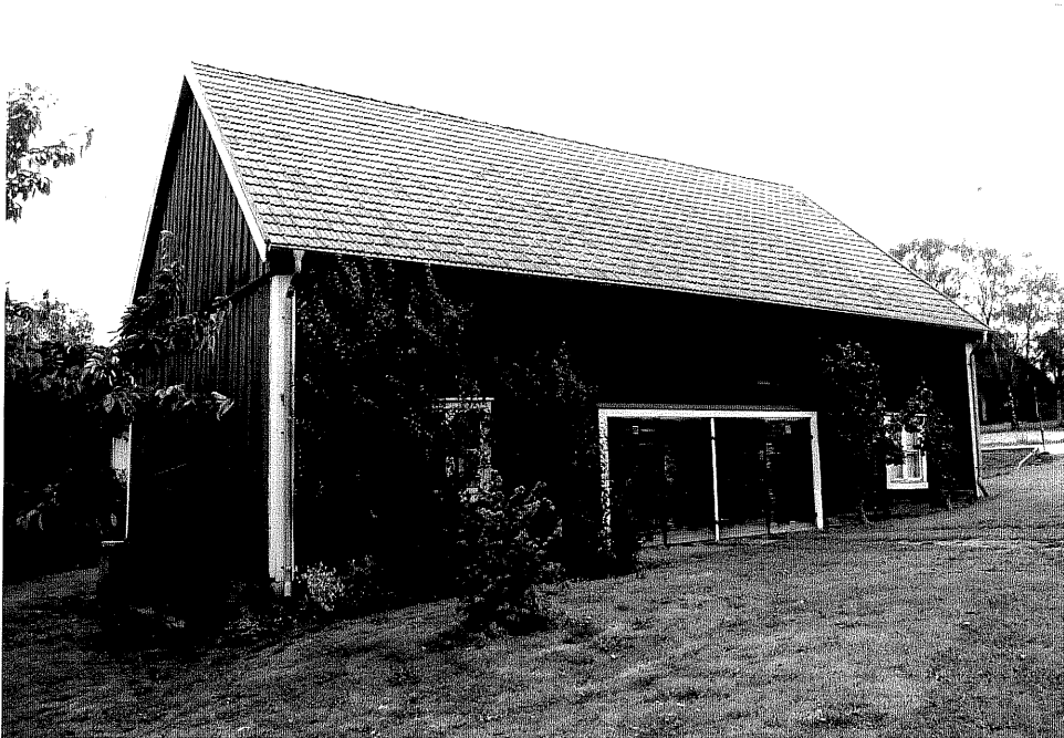
Neg. nr. V.T 04:29 Bod mot nordväst