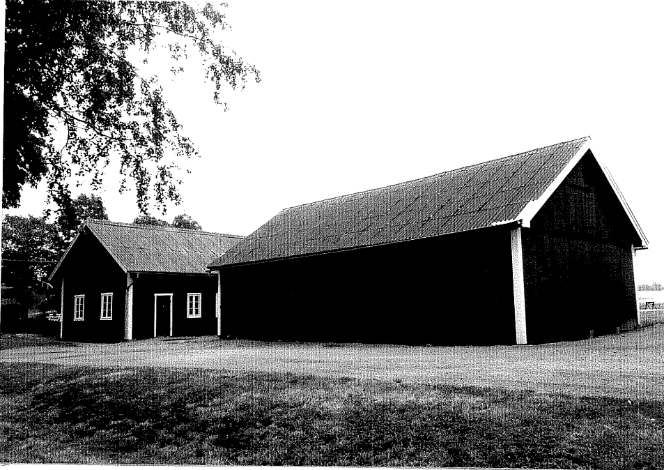
Neg. nr. V.T 04: 25 Vagnslider mot nordväst