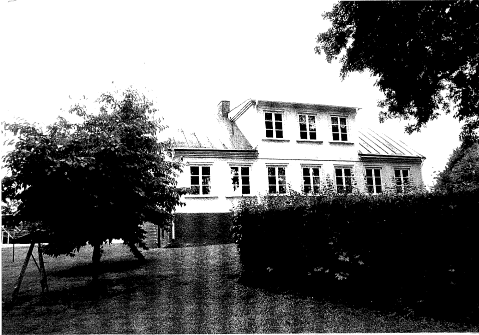
Neg. nr. V.T. 04:28 Mangårdsbyggnad mot nordost

Ödeshögs kommun V:a Tollstad socken Hästholmen 10 1 Västergården