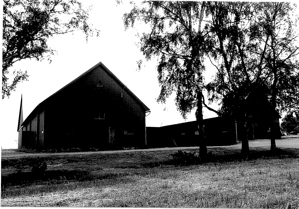
Neg. nr. V.T 04:24 Ladugård mot nordöst