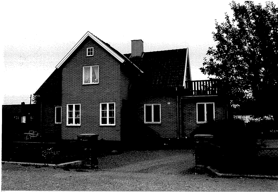
Neg. nr. V.T 01:16 Bostadshuset mot norr