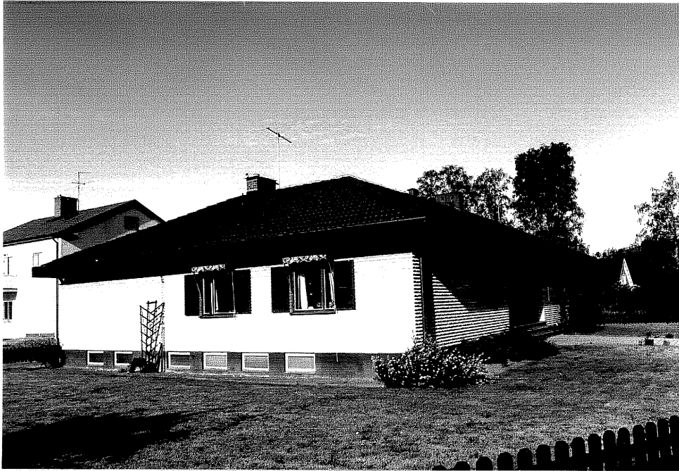
Neg. nr. V.T 02:32 Bostadshuset mot öster

Ödeshögs kommun V:a Tollstad socken Hästholmen 7 10 Krokgatan 7