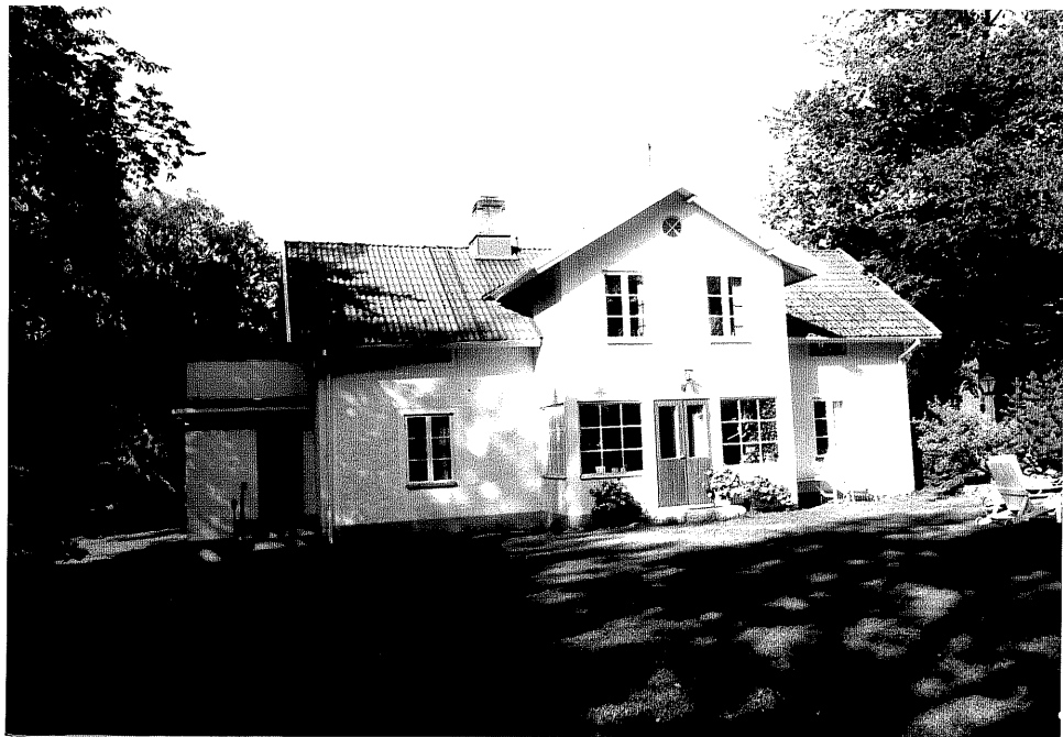
Neg. nr. V.T 03:1 Mangårdsbyggnad mot öster

Ödeshögs kommun V:a Tollstad socken Hästholmen 7 24 Drottning Ommas väg 3