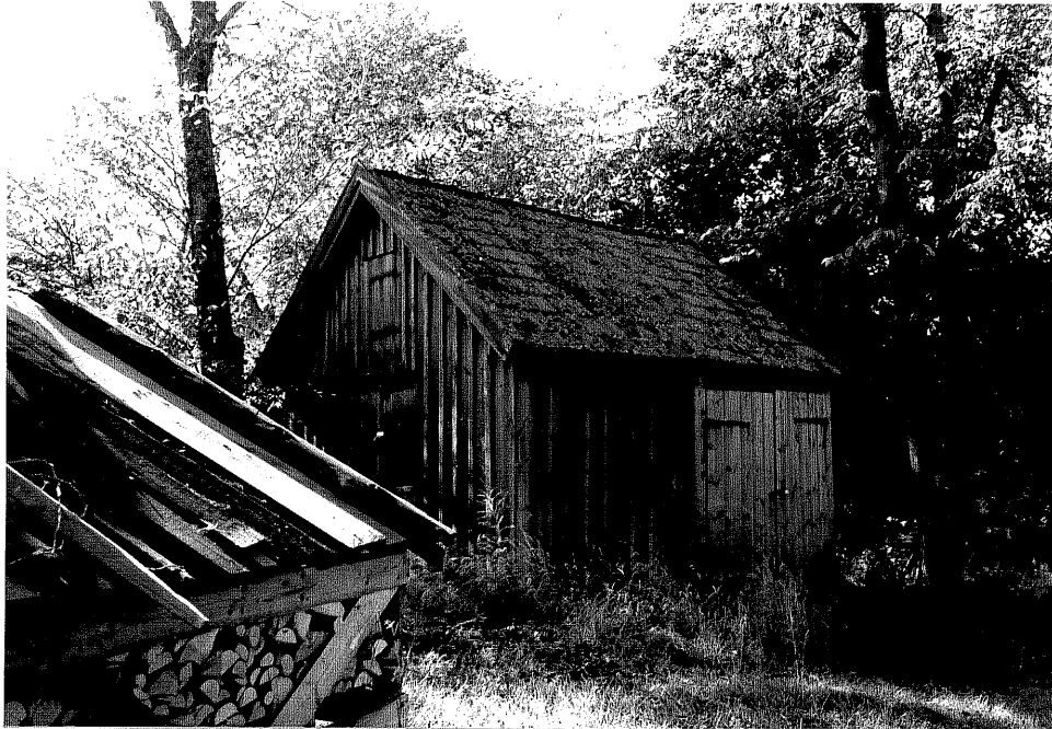
Neg. nr. V.T 03:5 Uthus mot norr