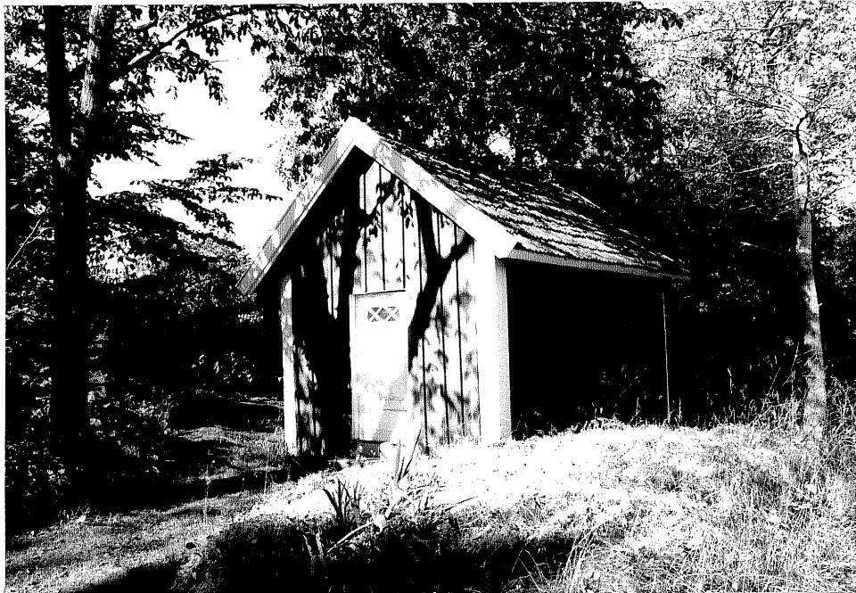
Neg. nr. V.T 03:4 Uthus mot öster