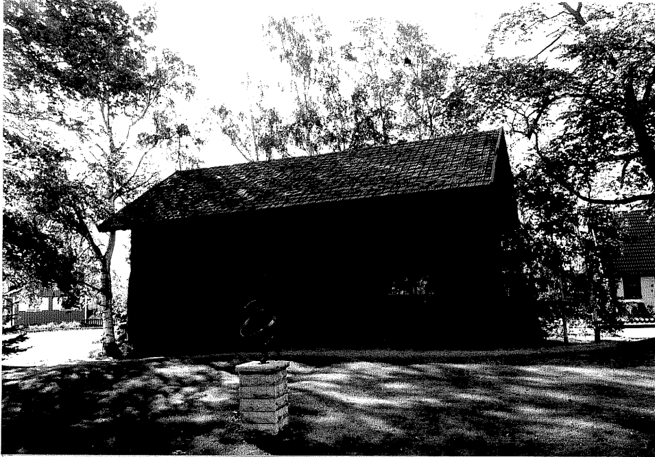
Neg. nr. V.T 03:3 Bod mot nordväst