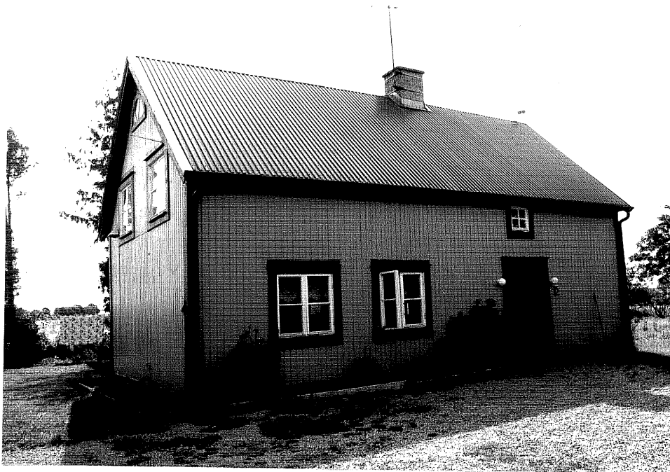
Neg. nr. V.T 03:37 Bostadshus mot norr

Ödeshögs kommun V:a Tollstad socken Hästholmen 7 32 Hamngatan 29