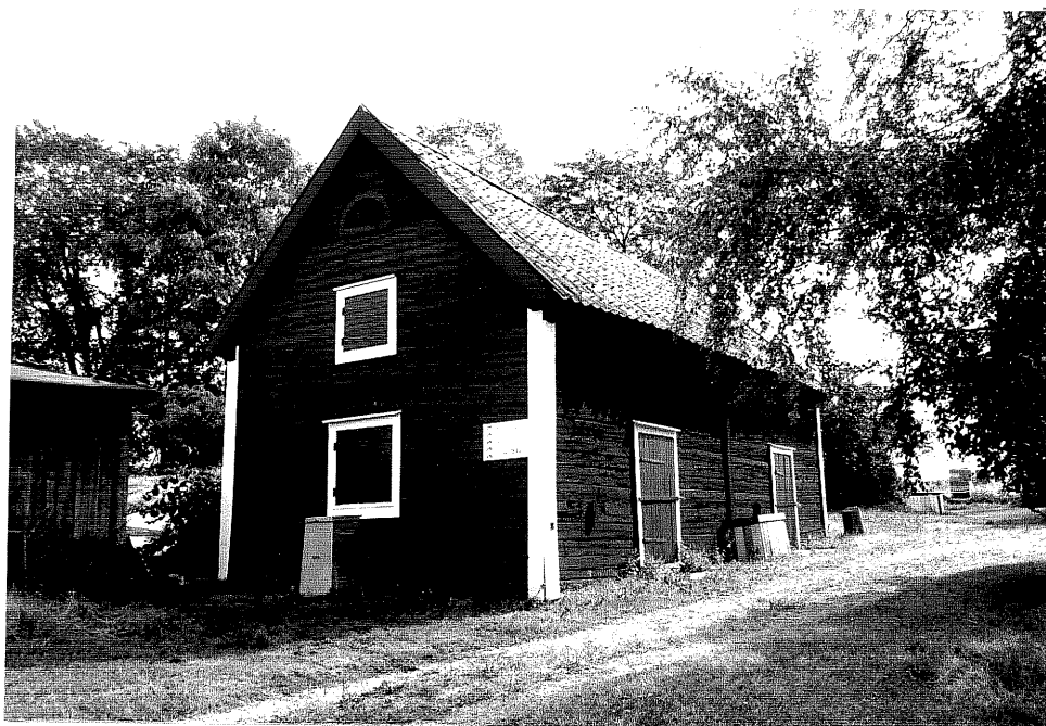
Neg. nr. V.T 04:0 Bod mot nordväst