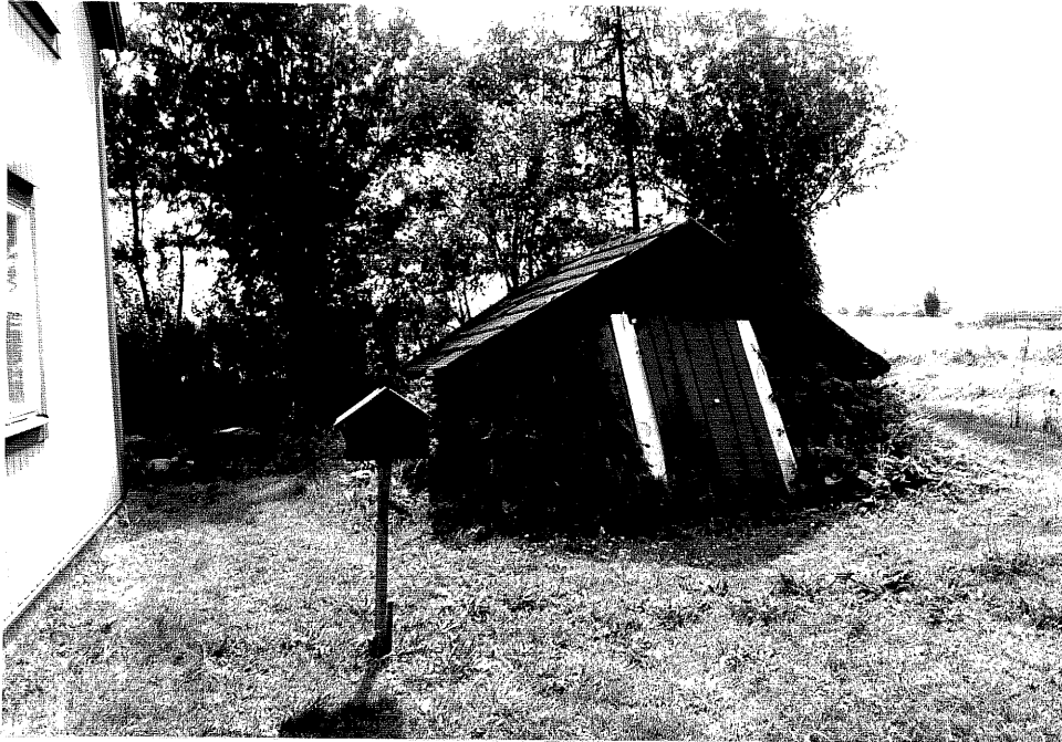
Neg. nr. V.T 03:36 Jordkällare mot norr