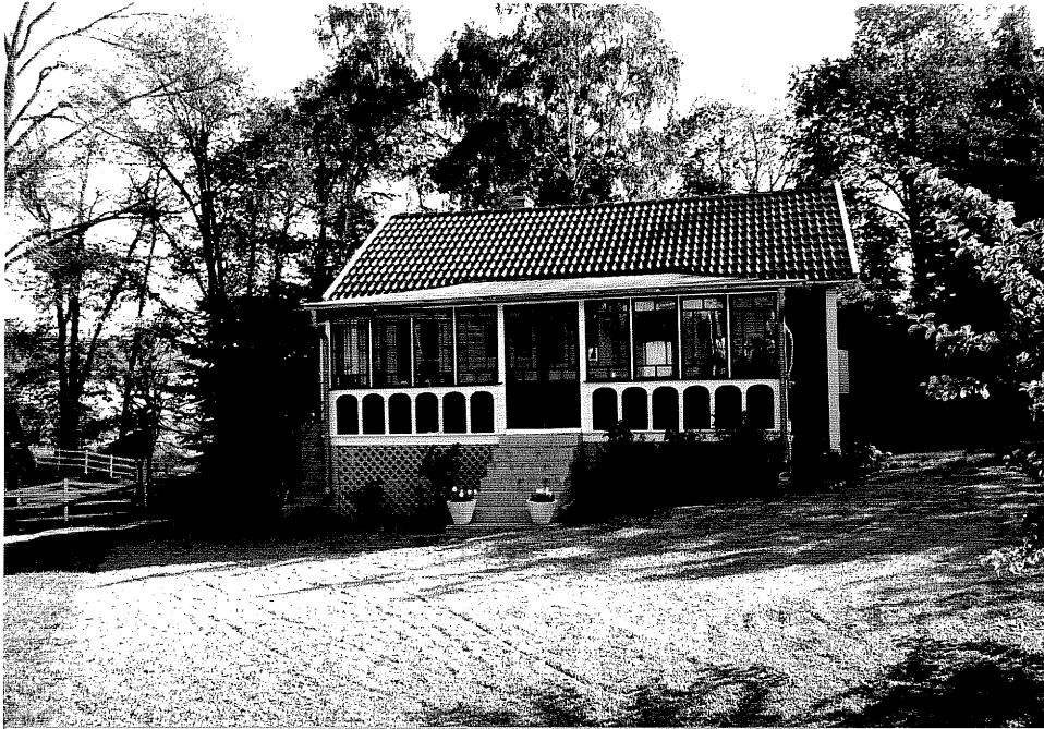
Neg. nr. V.T 03:7 Bostadshus mot sydväst

Ödeshögs kommun V:a Tollstad socken Hästholmen 7 51 "Bokudden" Drottning Ommas väg 1