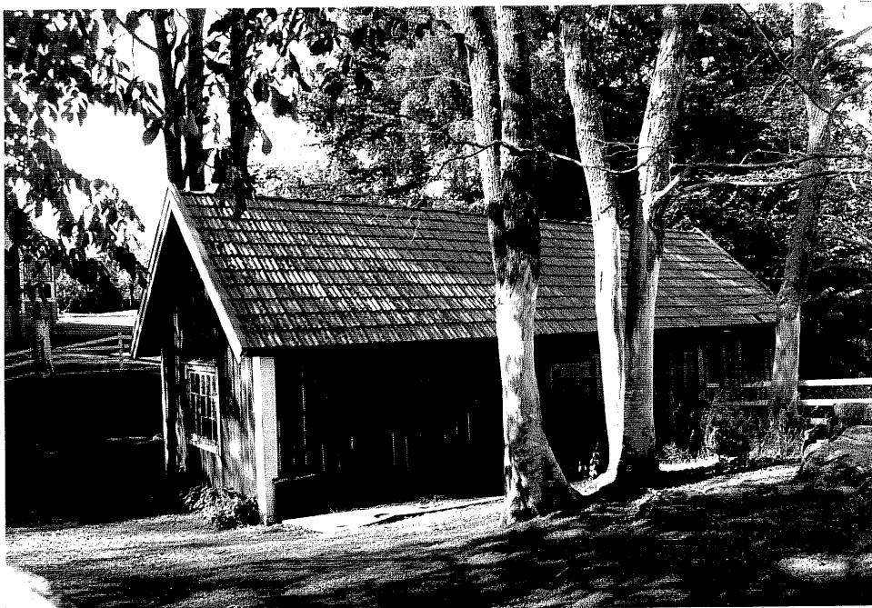
Neg. nr. V.T 03:6 Uthus mot norr