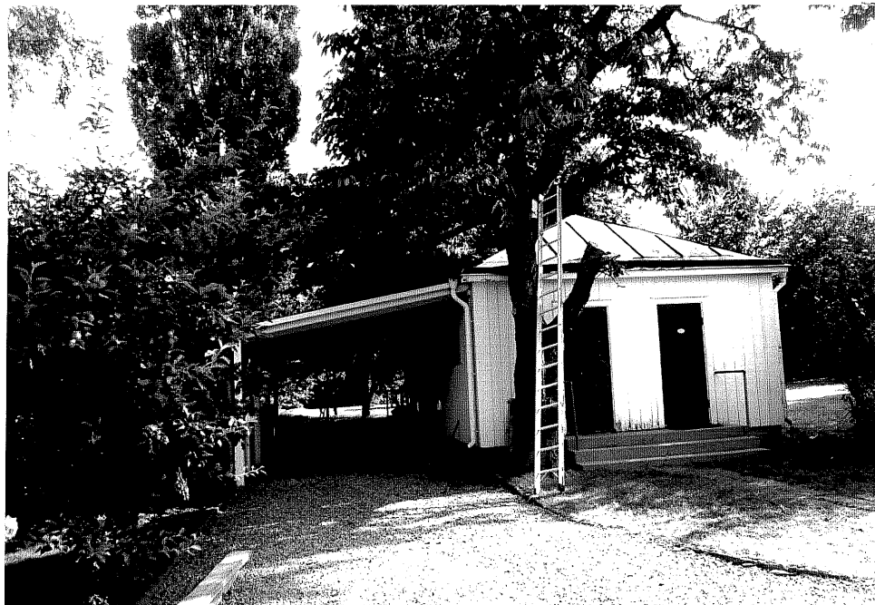
Neg. nr. V.T 03:16 Uthus mot väster