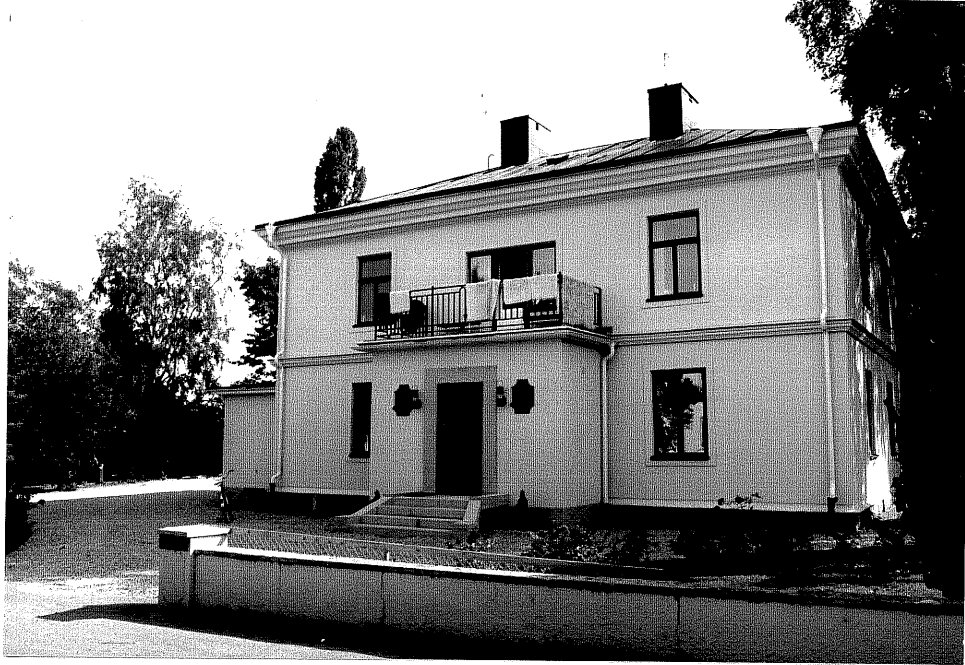
Neg. nr. V.T 03:15 Bostadshuset mot sydväst

Ödeshögs kommun V:a Tollstad socken Hästholmen Hallegården 4 19 Bokgården Hallegatan 2