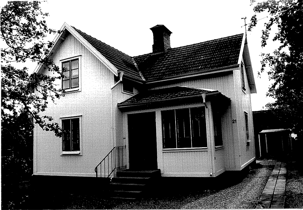
Neg. nr. V.T 02:19 Bostadshuset mot nordväst

Ödeshögs kommun V:a Tollstad socken Hästholmen Hallegård 4 30 Hamngatan 21