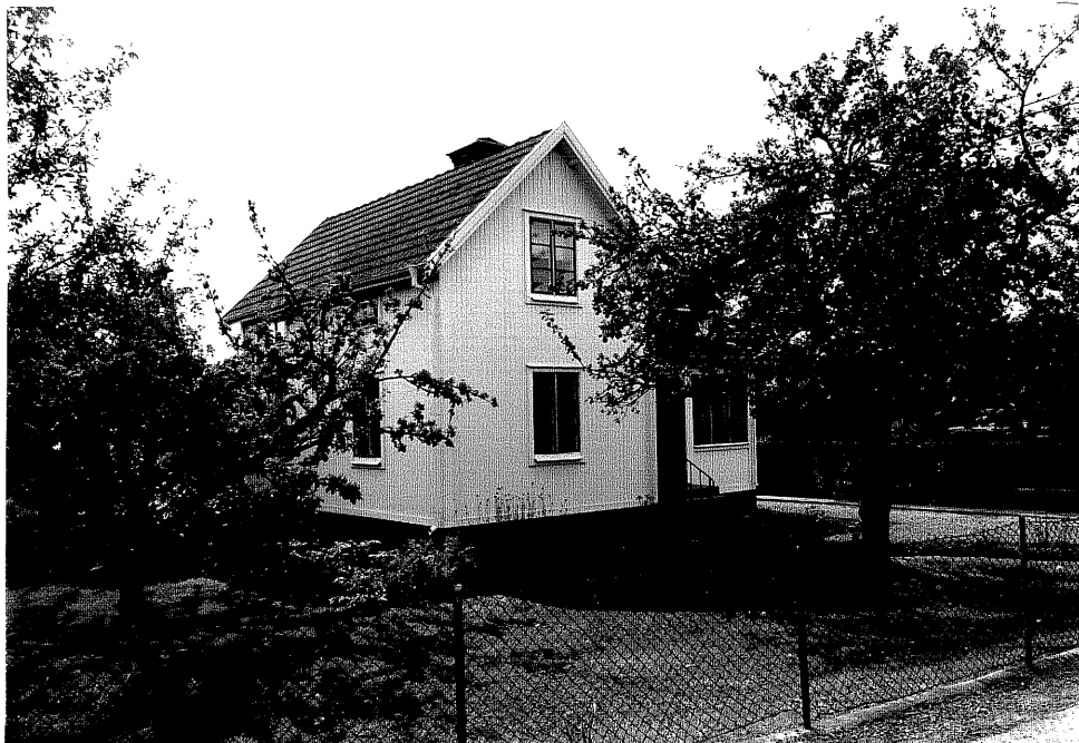
Neg. nr. V.T 02:16 Bostadshuset mot norr