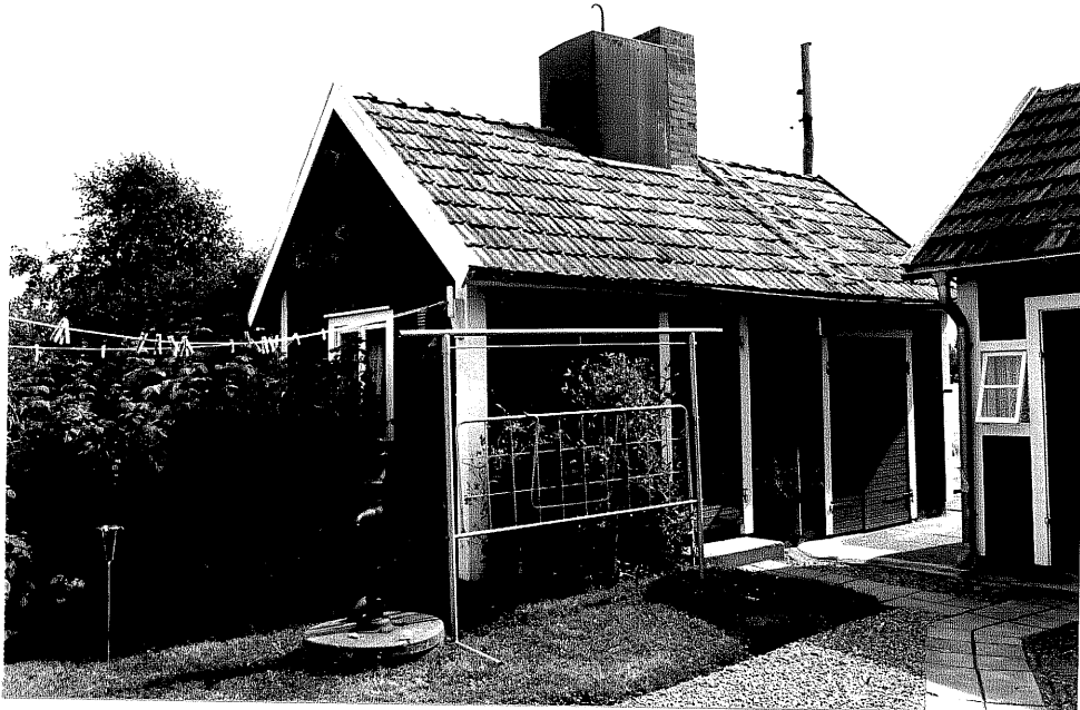
Neg. nr. V.T 02:17 Uthus mot väster