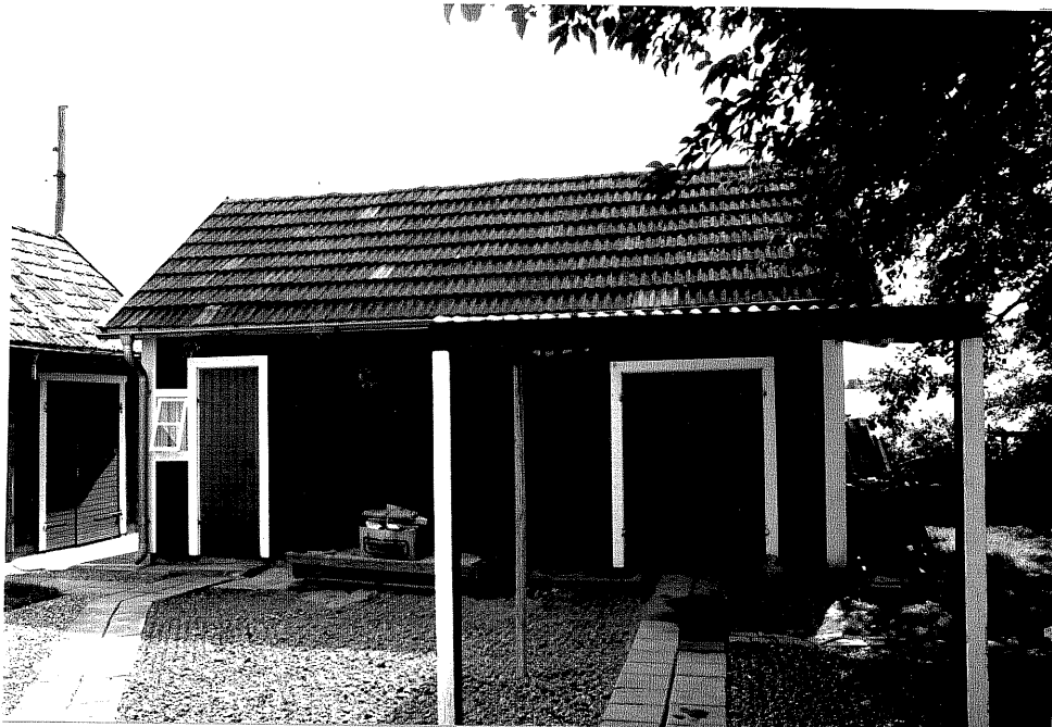
Neg. nr. V.T 02:18 Uthus mot nordväst