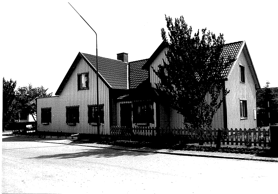
Neg. nr. V.T 02:22 Bostadshuset mot nordväst

Hästholmen Hallegården 4 31 "Halledal" Hamngatan 23