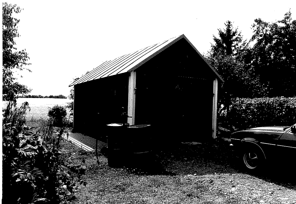
Neg. nr. V.T 02:20 Garage mot norr