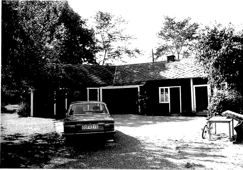
Neg. nr. V.T 03:28 Uthus mot nordost