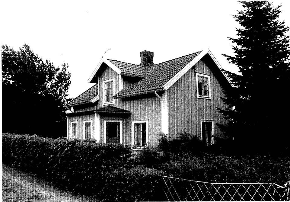
Neg. nr. V.T 01:18 Bostadshuset mot nordväst