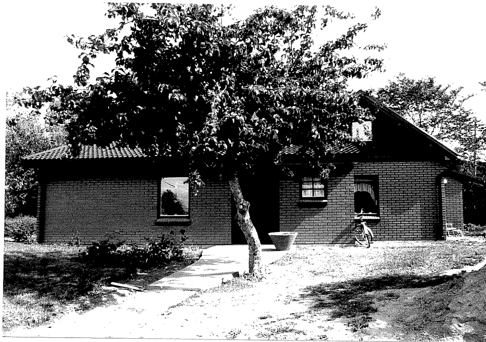
Neg. nr. V.T 03:34 Bostadshuset mot sydväst

Hästholmen Hallegården 4 16 Hamngatan 27