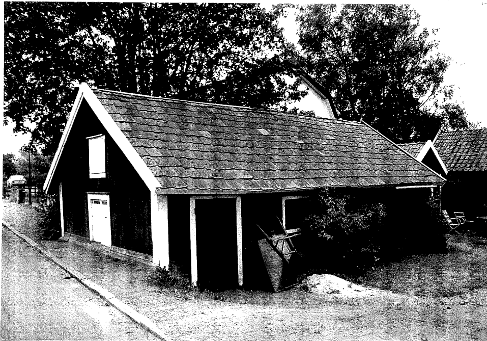
Neg. nr. V.T 01:7 Uthus mot nordväst