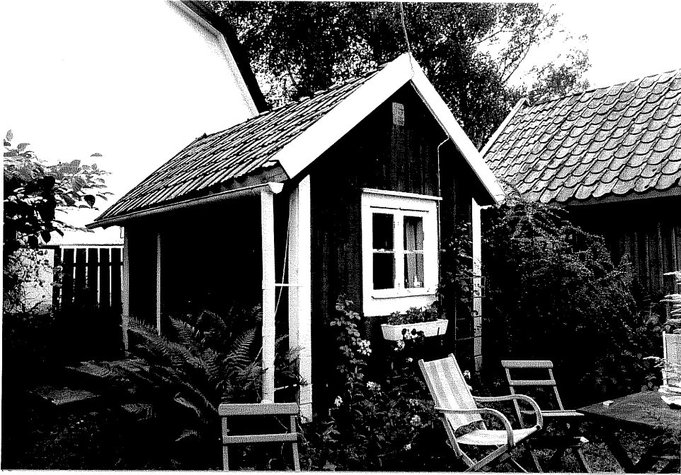
Neg. nr. V.T 01:9 Lillstugan mot nordväst

Ödeshögs kommun V:a Tollstad socken Hästholmen Hallegården 4 17 Tollstad 2 13 , "Lugnet" Hamngatan 5