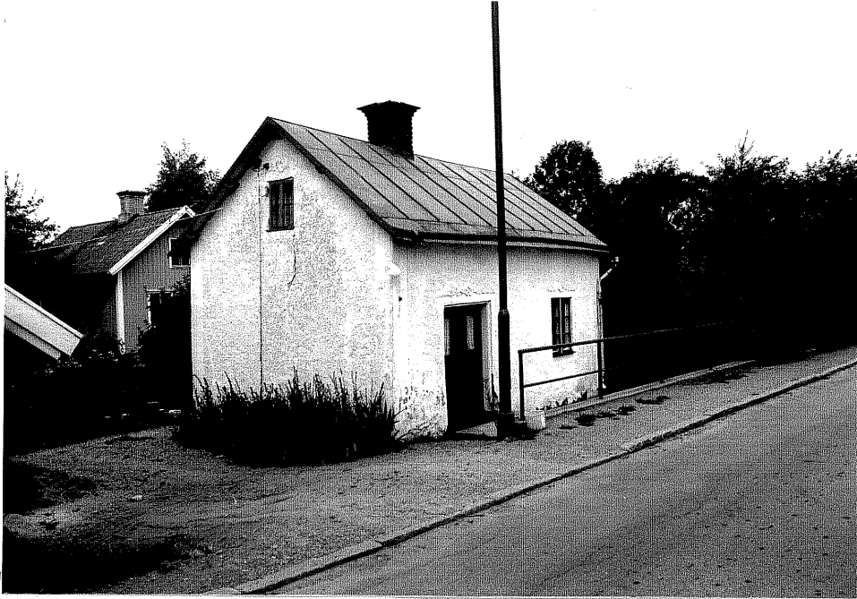
Neg. nr. V.T 01:8 Bostadshuset mot nordost

Ödeshögs kommun V:a Tollstad socken Hästholmen Hallegården 4 17 Tollstad 2 13 , "Lugnet" Hamngatan 5